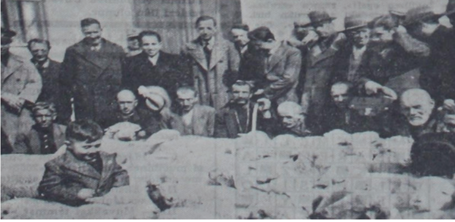
Fotoğraf: 5 Merinos koyun yetiştiriciliği yarışmasında ödül alanlar bir arada (1937) Kaynak: Cumhuriyet , 29 Mart 1937

Tüm teşvik ve ödüllere karşın 1934'ten 1952'ye kadar geçen on sekiz yıl içinde merinos yetiştirme bölgesinde 133.343 ve Türkiye genelinde 149.944 merinos melezi seviyesine ulaşıldı. Bu miktar ülkenin yapağı ihtiyacını karşılayacak seviyede olmadığından dolayı merinos fabrikası için özellikle 1946-1948 yılları arasında yapağı ithali gerçekleştirildi. 89