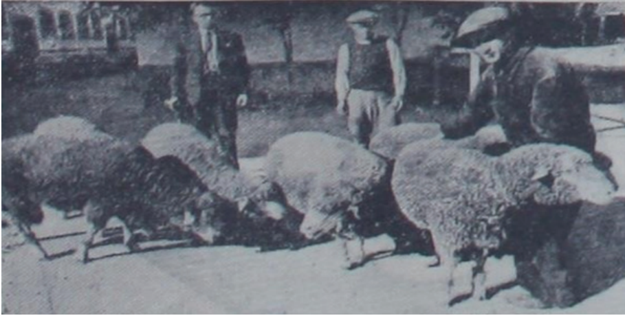
Fotoğraf: 3 Almanya'dan getirilen merinos koçlarından bir kısmı