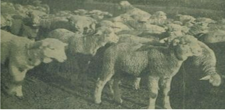
Fotoğraf: 4 Merinos melezi koyunlar

Köylünün elinde 1938’de 4.715 dişi ve 317 erkek yarım kan merinos vardı. Merinos bölgesindeki diğer merinoslar ile bu sayı 11.719 dişi ve 2.122 erkek olmak üzere 13.841’e ulaşmaktaydı. 81 Aynı yıl Türkiye’deki toplam merinos koyun ve kuzu sayısı yaklaşık 50.000 idi. 82