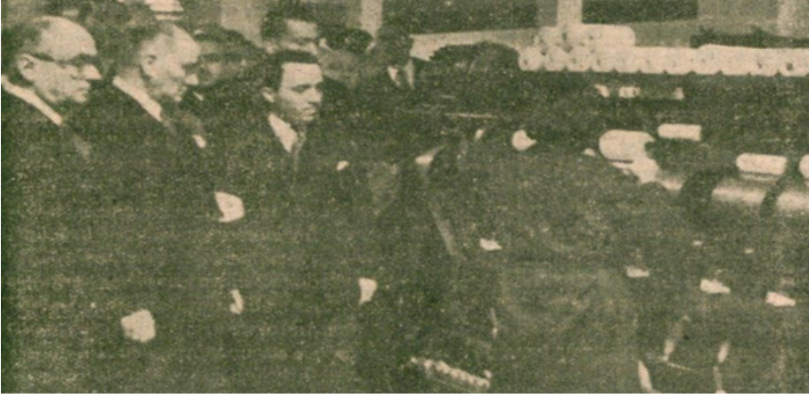
Fotoğraf: 8 Atatürk, Bursa Merinos Fabrikası'nda incelemelerde bulunurken (1938)

Başvekil Celâl Bayar 2 Şubat 1938'de Bursa Merinos Fabrikası'nın açılışı münasebetiyle yaptığı konuşmasında şu bilgileri paylaştı: