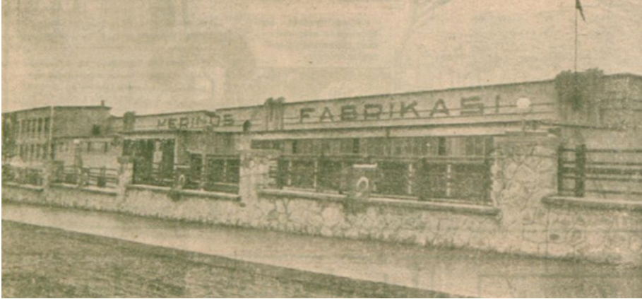
Fotoğraf: 9 Bursa Merinos Fabrikası'nın ön cephesinden bir görüntü (1938)

Fabrika, iplik ve kumaş üretiminin yanı sıra bulunduğu çevreye çeşitli sosyal imkânlar sunmaktaydı. Bu bakımdan işletme bünyesinde dokuz kişilik bir sağlık ekibi vardı. Tedaviler; röntgen, elektrokardiyografi ve diş ünitesi olduğu beş yataklı bir revir ile ultraterm, diyaterm, sonostat, enfraruj ve ultraviyole cihazının bulunduğu bir fizik tedavi bölümünde yapılmaktaydı. Bunun dışında; kreş, sinema ve sosyal tesisler yer almaktaydı. 135