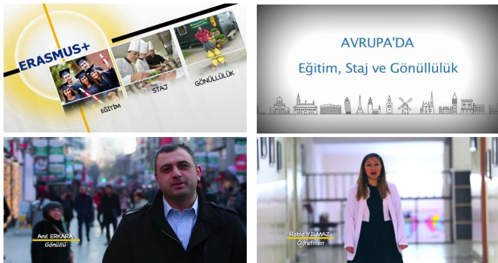
Şekil 4: Kamu Spotu 4’e ait Alt Kareler