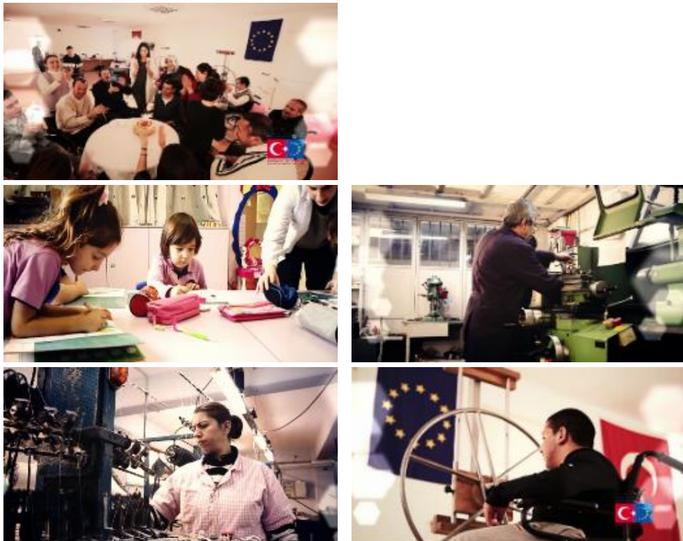
Şekil 1. Kamu Spotu 1’in Alt Karelerine Ait Görüntüler