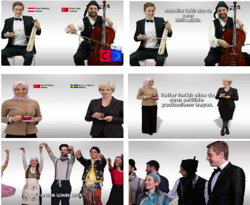
Şekil 2: Kamu Spotu 2’ye ait alt kareler