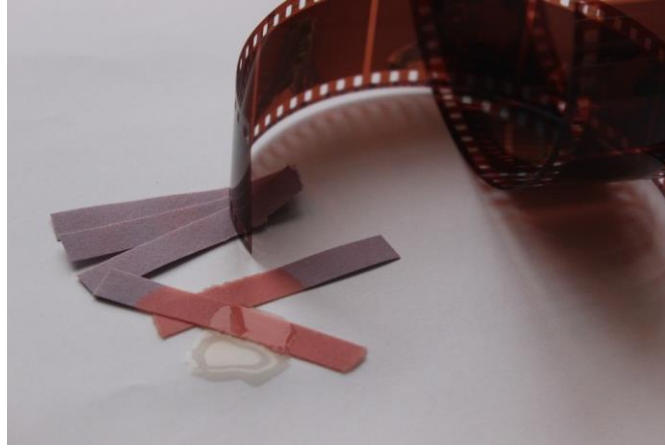
Resim 1. Ayşe'nin Benlik Algısına İlişkin Çalışması.

Cansu: Öğrencilerden Cansu, kendisini tanımlamaya çalıştığında “tüketmek, yol göstermek ve inanmamak” kavramlarına ulaşmıştır. Seçtiği kavramlara yönelik Cansu “tüketmek, yol göstermek, inanmamak kavramları kimliğimi tanımlayan ifadelerdir.” cümlesini kullanmıştır. Kendisini sorgulaması sonucunda ulaştığı kavramları sanatsal ürüne dönüştürmede şapka, saat ve kitap objelerini kullandığı görülmektedir. Bu objelerle benliğine ilişkin belirlediği temalar arasında kurduğu bağlantıyı şu şekilde açıklamıştır: