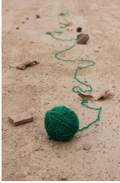
Resim 5: Serpil'in Benlik Algısına İlişkin Çalışması.

Çağan: Öğrenciler arasında en farklı çalışmayı ortaya koyan öğrencidir Çağan. Benliğini en iyi anlatan kelimenin “gel git” olduğunu ifade eden Çağan, bunu pisuar ile bizlere göstermesi açısından farklılık yaratmıştır. Sadece seçtiği obje ile değil, kavram ile objenin kullanımını, anlam ilişkisini de başarılı bir şekilde kurmayı sağlamıştır.