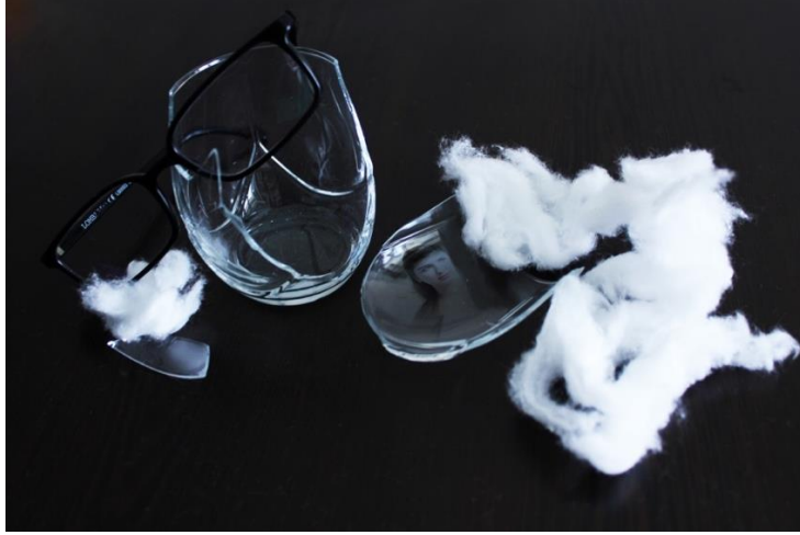
Resim 9. Gizem'in Benlik Algısına İlişkin Çalışması.

Nihal: Öğrencilerden Nihal, kendisini en iyi tanımlayan kavramın “karmaşıklık” olduğunu söylemiştir. Nihal benlik algısına yönelik çalışmasının manifestosunda “ Kendimi tanımlamam gerekirse tek kelimeyle karmaşıklık denir. Kişiliğimle özdeşleştirdiğim objem ise bozuk, karıncalı gösteren bir televizyon. Bulantılı hatıralarım, netleşmeyen kareler halinde beynimin bir köşesinde hapis halindedir. Karıncalı görüntüsünün altından gelen cızırtılı bozuk sesler iç sesimi yansıtıyor. ” sözlerini kullanmıştır.