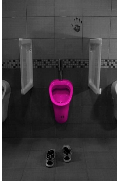
Resim 6. Çağan'ın Benlik Algısına İlişkin Çalışması.

Çağan, manifestosunda çalışmasının çıkış noktasını şu sözlerle ifade etmiştir: