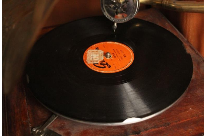
Resim 4. Büşra'nın Benlik Algısına İlişkin Çalışması.

Serpil: Öğrencilerden Serpil, benliğini “hırs ve sıcaklık” kelimeleriyle tanımlamıştır. Seçtiği kavramları ve çalışmasını aşağıdaki sözlerle açıklamıştır: