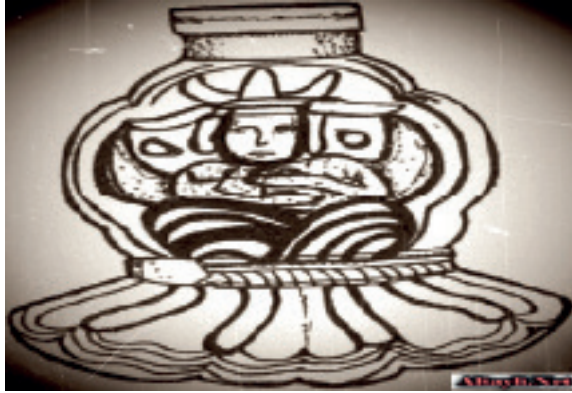
Şekil 1. Umay Ana Tasviri

Türk destanlarında kadına karşı duyulan sarsılmaz güven, sevgi, saygı ve bağlılık çokça dile getirilmiştir. Kadim zamanların Türk topluluklarında kadının erkeğin eksiği olarak değil de eşiti, hayat arkadaşı, başı sıkışınca sırtını dayadığı yoldaşı olarak algılandığı görülür.