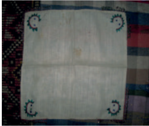
Şekil 2. Antropomorfik işlemeli mendil (Kayabaşı, O.A.(2016) Taşeli Yöresi Tahtacılarının Geçiş Dönemlerinde Mitolojik Unsurlar, Türk Kültürü ve Hacı Bektaş Veli Araştırma Dergisi, 78, 139)

( http://www.altayli.net/turk-takilarinda-umay-inancinin-izleri-ve-avrasya-kokleri.html/3 )