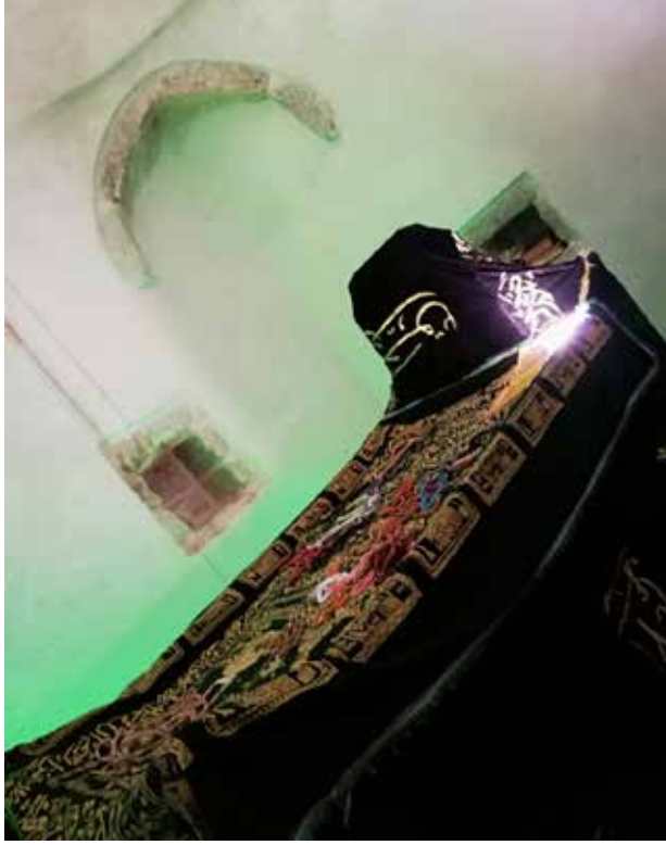
Resim 6 (Zeynel Abidin Türbesi, Zeynel Abidin'in mezarı).