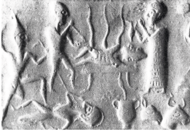
Figür 6: Tyskiewicz mührünün baskısı. (Kaynak: Akyurt, 1998: Lev. 47-b).

mitolojik bir sahnenin işlendiğini ve eğer bu sahne bir yakma töreni ise bu konuda Anadolu'da bilinen en eski ve tek tasvirin bu eser olduğunu belirtmektedir (Akyurt, 1998: 153-154). S. Alp de yakma töreni olarak değerlendirdiği bu mühürdeki sahnede, ölünün ayakucunda bulunan kişinin elinde tuttuğu ok ucuna benzer nesnenin köruk olabileceğini belirtmiştir (Alp, 1999: 44-45).