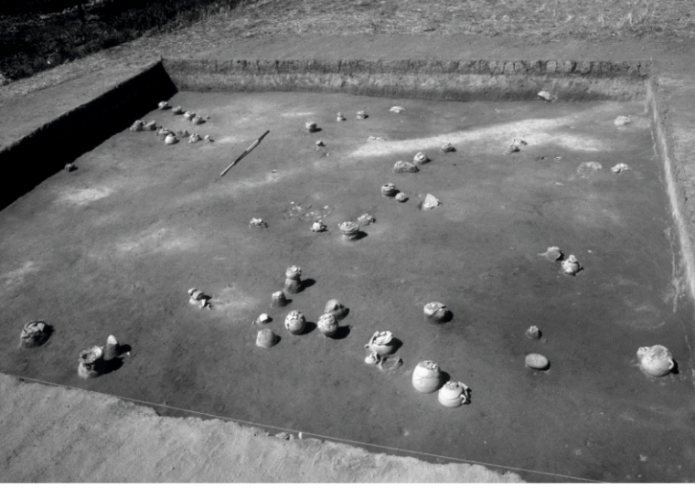
Figür 5: Arıbaş Mezarlığı.

Arıbaş Mezarlığı'nda mezarların dağılımlarına bakıldığında birçoğunun belirli gruplar halinde dizildiği görülmektedir (Figür 5). Öztan'a göre, grup halinde bulunan ve genellikle kuzeydoğu-güneybatı yönünde dizilmiş kremasyon mezarlar aile mezarlıklarını simgeliyor olabilirler (Öztan, 1998: 169).