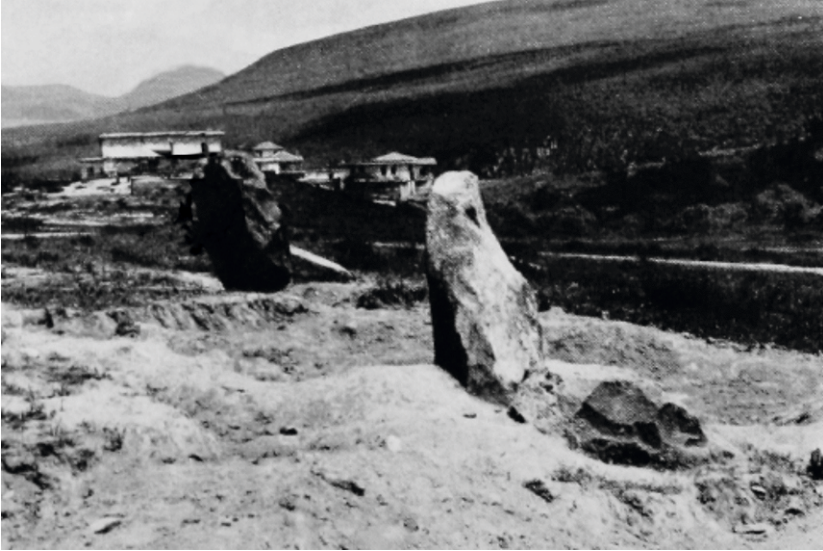
Figür 4: Ilıca Mezarlığı ve dikili taşlar. (Kaynak: Orthmann, 1967: taf. 8-d).

Mezarların etrafında çeşitli düzenlemelerin ve bazı dikkat çekici hususların olduğu görülmektedir. Özellikle, Ilıca Mezarlığı'nda bulunan ve mezarların yerini işaret ettiği Orthmann tarafından belirtilen dikili taşların/stellerin (Figür 4) varlığı, diğer mezarlıklarda görülmeyen ayırt edici bir özelliktir (Orthmann, 1967: 7). Orthmann'a göre bu dikili taşların bir aile mezarını da temsil etme ihtimali yüksektir (Orthmann, 1967: 38). H. Müller-Karpe, Ilıca Mezarlığı'nda urnelerin etrafında bulunan dikili taşların-stellerin ölü kültü ile ilişkilendirilmesi kanaatinde (Müller-Karpe, 1980: 680). Akyurt ise, bunların aile mezarları olup olmadığını anlaşılmasının zor olduğunu ve söz konusu stellerin ölüyü mezarı başında anabilmek, en azından mezarın bulunmasını kolaylaştırmak amacıyla mezarlık alanına konmuş olabileceği üzerinde durmaktadır (Akyurt, 1998: 46, 155).