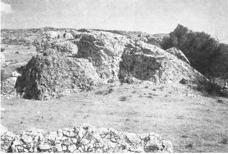
Figür 1: Osmankayası Mezarlığı.

Anadolu'da M.Ö. II. bine ait münferit halde ele geçen bazı örnekler hariç, kremasyon mezarların genellikle inhumasyon mezarlarla bir arada bulunduğu ve inhumasyon mezarların kremasyon mezarlara göre daha yoğun olduğu dikkati çekmektedir. K. Bittel, Osmankayası Mezarlığı'nda olduğu gibi (Figür 1) aynı alanda iki farklı gömme geleneğinin görülüyor olmasını, öteki dünya inançları farklı olan iki topluluğun aynı mezarlık alanını kullanıyor olması ile açıklamaktadır (Bittel ve diğ., 1958: 24).