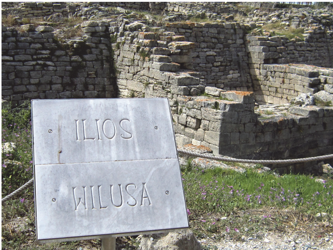
Abb. 1) Die Tafel.

Wenn man heute den sagenumwobenen Hügel von Hisarlık aufsucht, so sieht man als erstes einen Nachbau des hölzernen Pferdes (begehrbar) und dann eine vor der Burgmauer aufgestellte Tafel, die lakonisch oben ILIOS und unten WILUSA verkündet.