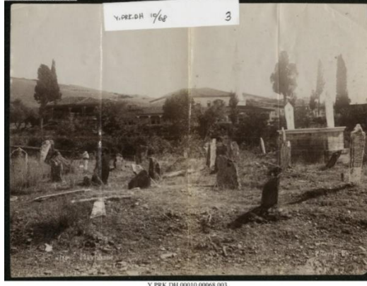
Resim: XIX. Yüzyılda Selanik Mevlevîhânesi'nin Cepheden Görünüşü ve Mezarlığı 50

Evliya Çelebi'nin kısımları hakkında bilgiler verdiği mevlevîhânenin haremî kale gibi demir kapılı olup, geniş meydanının ortasındaki semâhânesinin dört yanı parmaklıklarla çevrilmiştir. Ayrıca semâhânenin kubbesi ve etrafındaki güzel sütunlar oldukça sanatla süslenmiş ahşap yapılarıdır. Mevlevîhânenin aydınlatmasının ise kıymetli avizelerle yapıldığını anlatan Evliya, yüz civarında dedesi bulunduğundan da söz eder 49 .