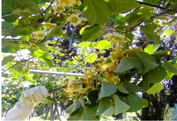
Şekil 1. Hayward kivi çeşidi çiçeklerine yapılan elle tozlama uygulamasından bir görünüm.

Bal arısı ve bombus arısı kullanılarak yapılan tozlama uygulamalarında her bir tekerrür için 5'er adet Hayward ve 1'er adet Tomuri omcası, çiçeklenme dönemi öncesinde metal iskelet içerisine alınarak arı tülü ile kapatılmıştır. Bal arısıyla tozlama uygulamasında (AKABAT), her bir tekerrür içerisine 2010 yılında 2 adet arılı çerçeve içeren mini kovan yerleştirilmiştir. Bal arılarının 2010 yılında her bir tekerrür içerisine sebebiyle, 2011 yılında her bir tekerrür içerisine yaklaşık 200 adet bal arısı içeren ana arı kutuları konulmuştur (Şekil 3). Bombus arısıyla tozlama uygulamasında (AKABOAT), her bir tekerrür içerisine 50 civarında bombus arısı içeren kovan konulmuştur (Şekil 4).