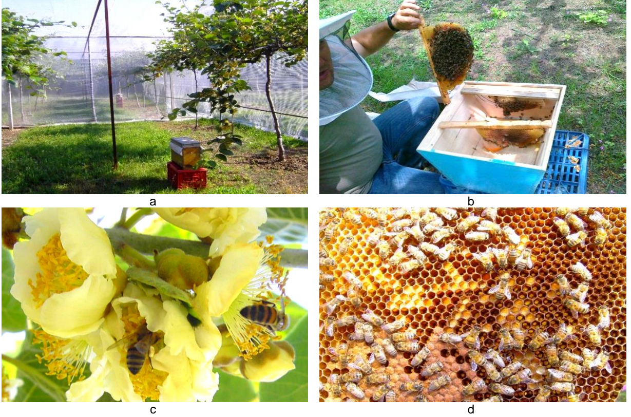
Şekil 3. Bal arısıyla tozlama uygulamasının yapıldığı parselden bir görünüm (a, 2010 yılı), 2011 yılında bal arısıyla tozlama uygulamasında kullanılan ana arı kutusunun görünümü (b), Bal arılarının Tomuri (erkek) kivi çeşidinin çiçeklerini ziyaretinden bir görünüm (c) ve Peteklerdeki kivi polenlerinin görünümü (d).