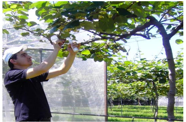
Şekil 2. Suni tozlama uygulaması için polenlerin talk pudrası ile karıştırılması uygulamasından bir görünüm (a) ve Talk pudrası ile karıştırılan polenlerin piset vasıtasıyla dişi çiçeklere püskürtülmesi uygulamasından bir görünüm (b).