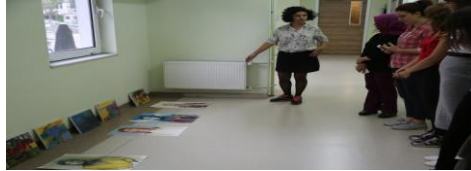
Fotoğraf 8. Katılımcılarla atölye çalışmalarının değerlendirilmesi, 4 Ekim 2018.

4 Ekim 2018 (4.Uygulama): Son gün atölye çalışmasına diğer günlerde olduğu gibi 8 kişi katılmıştır. Portre çalışması sonlandırılmıştır. Bu güne kadar yapılan çalışmalar sunuma açılmıştır. Çalışmalar hakkında değerlendirmeler yapıp, görüşler alınmıştır. Daha sonra suluboya veya birkaç malzemenin birarada kullanıldığı özgün bir çalışma yapılmasına geçildi. Bu çalışmayı gerçekleştiren kişiler peyzaj ve soyut içerikte çalışmalar üretmişlerdir. 4. günün sonunda üretilen çalışmalar fotoğraflanarak arşivlenmiştir. İlk gün gözlenen kaygının yerini özgüven, rahatlama, kendine güven almıştır. Tüm bunlar gözlem notları referans alınarak vurgulanmıştır (bkz. Ek-6).