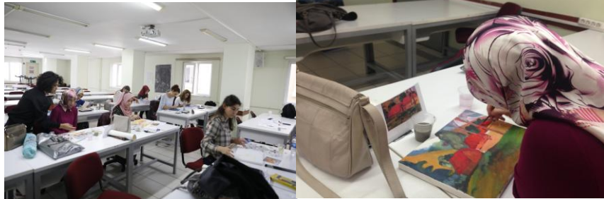
Fotoğraf 1. Röprodüksiyon çalışması, Atölye eğitiminde ilk gün, 1 Ekim 2018.

Öncelikle teklifimi kabul ettiğiniz için teşekkür ederim. Görüşmeye başlamadan önce sizi çalışmanın amacı hakkında bilgilendirmek istiyorum. Bu çalışmanın amacı, sizin bu öğrenme grubuna katılımında motive eden faktörleri, görsel sanatlar eğitiminden beklentileriniz ve sonuçlarını belirlemektir. Görüşmemiz uygulamanın ilk günü ve son günü olmak üzere yaklaşık 45 dakika sürecektir. Verdiğiniz cevaplar gizli tutulacaktır, çalışmayı yürüten araştırmacı veya araştırmacılar dışında kimseyle paylaşılmayacaktır. Görüşmeye istediğiniz an ara verebilir ya da bitirebilirsiniz. Eğer kabul ediyorsanız görüşmemiz sırasında fotoğraf çekimi yapılacaktır.