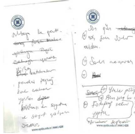
Ek 2. Gözlem Notu II