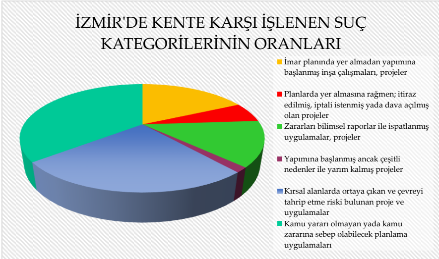
Şekil 4. İzmir Kente Karşı İşlenen Suç Kategorilerinin Oranları, 2019