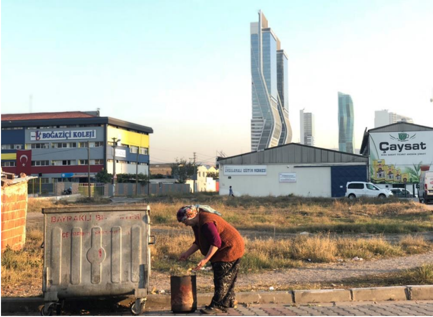
Şekil 2. İzmir’de mekânsal çatışma, Bayraklı (Şeyda Kaya Arşivi, 2018)