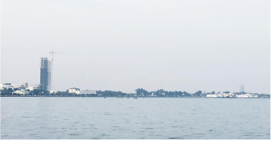
Şekil 1. Önde yürütme durdurma kararına rağmen inşaatı devam eden İstinyePark ve arkada onun öncülü olan Özdilek