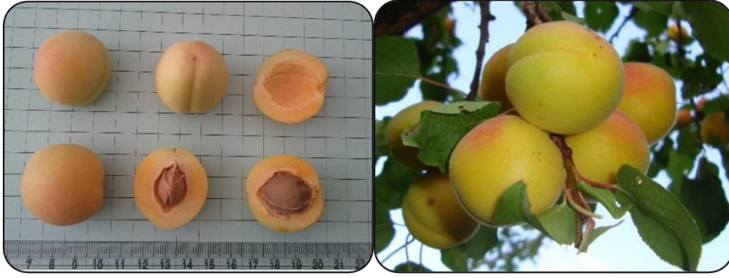
Şekil 1. Levent kayısı çeşidi