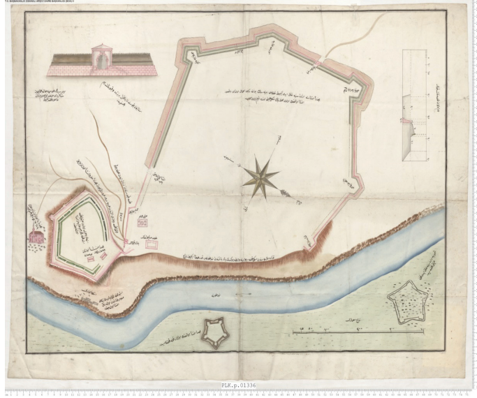
EK 3: Tuna Nehri'nin iki yakasında yer alan kale planlarına göre: üstte Niğbolu Kalesi, alt sağda eski Kulle, alt solda ise Yeni Kulle kaleleri yer almaktadır (BOA, PLK. P, 1336).