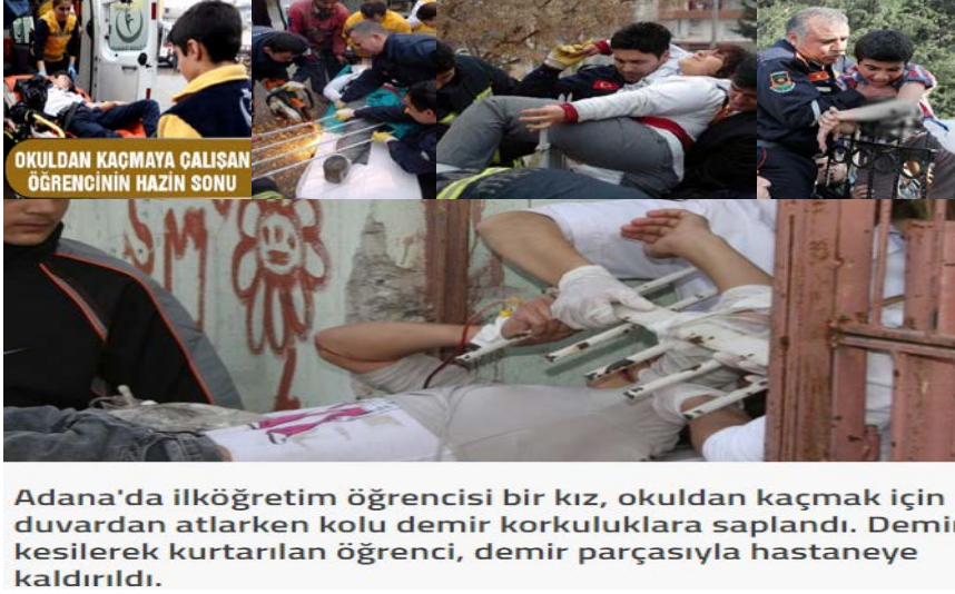
Şekil 2. Öğrencilerin okuldan kaçarken yaralanmalarına dair basında yer alan haberlerden bazı fotoğraflar (Anadolu Ajansı, 2009)

Tüm bunlardan yola çıkarak “öğrencilerin kendilerini hayata hazırlamayı amaçlayan bir kurum olan okuldan kaçma isteklerinin nedenlerini belirlemek, bu durum karşısındaki duygularını, okuldan kaçmaları önlemek için alınan önlemler hakkındaki fikirlerini ve okuldan kaçma durumu hakkındaki çözüm önerilerini öğrenmek” bu araştırmanın amacını oluşturmaktadır.