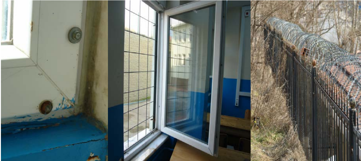
Şekil 1. Öğrencilerin okuldan kaçmasını önlemek için alınan önlemlerden bazı örnekler

Öğrenciler, kendilerini hayata en iyi şekilde hazırlamayı amaçladığı ve tamamen iyi niyetle kurulduğu düşünülen/varsayılan okullardan kaçmaktadırlar. Okul yönetimi de okuldan kaçmaları önlemek için bir dizi fiziksel önlem alabilmektedir. Bu önlemlerin arasında okulun çevresine örülen tel örgüler ve jiletli teller de olabilmektedir. Bunun dışında öğrencilerin zemin kattaki, okulun arka tarafına bakan sınıfların ve koridorların pencerelerinden atlayarak kaçmaları üzerine, pencerelerin bir daha açılmamak üzere vidalandığı, kollarının söküldüğü ve parmaklık eklendiği görülmüştür (Şekil 1). Bu fotoğraflar okul yönetiminin izni dâhilinde çalışmanın yapıldığı okulda çekilmiştir.