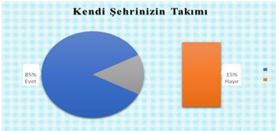
Grafik 2. Taraftarların kendi şehirlerinin takımını destekleyip- desteklemediğine ilişkin görüşleri

Taraftarların %85'i kendi şehirlerinin takımlarını desteklerken, %15'i şehirlerinin takımlarını desteklemediklerini belirtmişlerdir (Grafik 2).