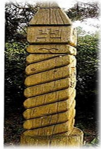
Resim 3: Yupa