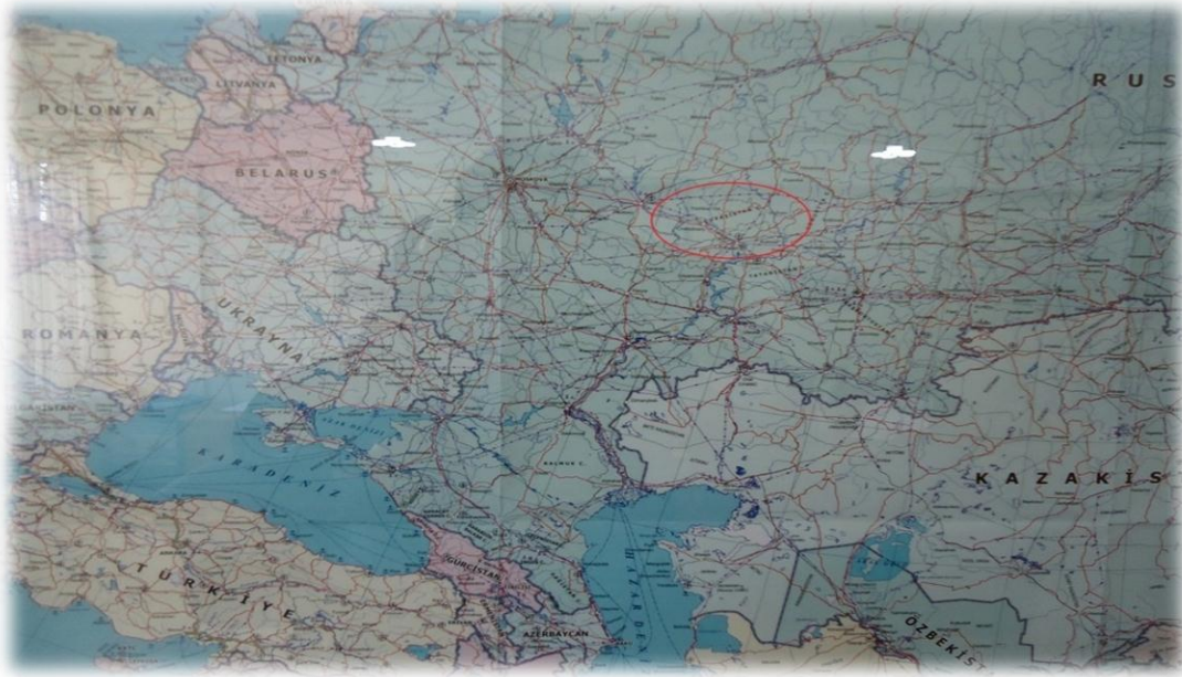
Harita : Coğrafyasında Çuvaşistan Özerk Cumhuriyeti

SSCB'nin dağılmasından sonra oluşan devletlerden biri olan Rusya Federasyonu 1993 yılında 21 Özerk Cumhuriyet, 11 Özerk Bölge, 2 özerk Belediye 6 Kray ve 49 Oblast'dan 1 oluşan 89 yönetim birimine ayrılmıştır.