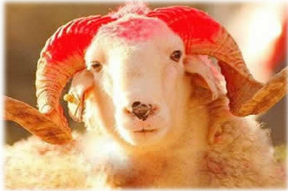
Resim 1 : Kurbanlık Koç.

Çuvaş Türklerinde "Harpan" denilen bir uygulama bulunmaktadır. Bu uygulama İslam inancından Çuvaşlara geçtiği kabul edilmektedir. Bu uygulamada beyaz koç kurban edilmektedir. Bu yüzden Harpan'ın İslam inancındaki Kurban kelimesinden geldiği kabul edilir 25 .