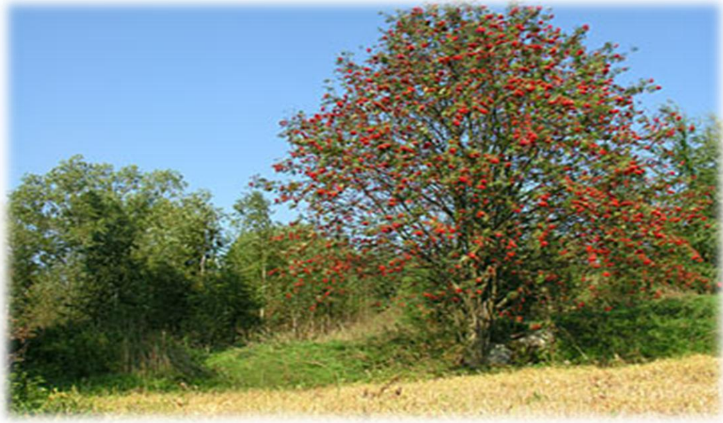
Resim 2: Üvez Ağacı