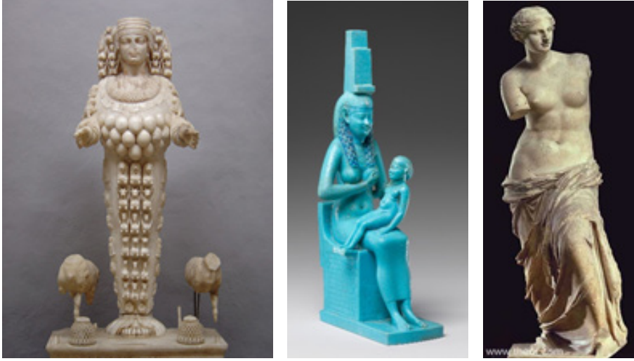
Görsel 8. Efes’li tanrıça “Artemis” heykeli. (Solda)

“İsis”, Girit’te “Rhea”, Ephesos’da “Artemis”, Yunan’da “Afrodit”, Roma’da “Venüs” tanrıçaları almıştır (Kemal, 2014: 9). (görsel 8,9,10) Semboller, eşlik eden hayvanları, mitolojik hikayeleri, anlatım dilleri değişse de ana tanrıçaların üstlendiği anlamlar değişmemektedir. Farklı zaman ve dönemlerde dahi olsa insanlara bereketi, hayatın devamlılığını, yaşam ve ölümün dengesini, doğumu ve çoğalmayı ifade etmektedir.