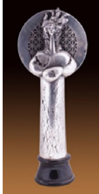
Görsel 11. Sadi Diren, İsimsiz, 2006, sırsız pişirim, 24cm x 14cm x 14cm (Solda)