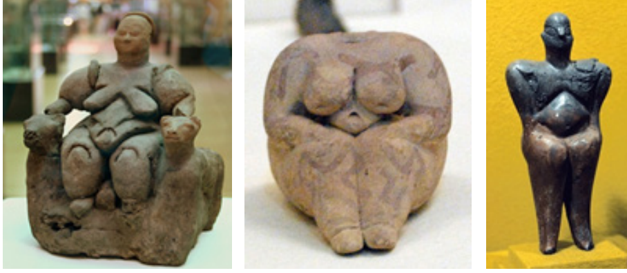
Görsel 4. İki yanında leoparları ile doğum yapan ana tanrıça figürü, Geç Neolitik Dönem, Çatalhöyük. (Solda)