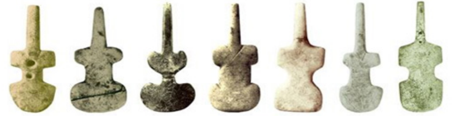
Görsel 7. Tunç çağı tanrıça idolleri.

göğüsleri küçülmüş iki boyutlu kadın figürlerinin almaya başladığı dikkat çekmektedir. Yapılan araştırmalar ve incelemeler idollerin ana tanrıçaları devam ettiren semboller olmalarının yanında ilk Tunç çağı sanatçıların insan bedenini üç boyuttan iki boyuta indirgemeyi başardığı objeler olarak bilim ve sanat dünyasında önemli kabul edilmektedir. Bir başka değişle bunların sanatsal anlamda önemli, özgün soyutlama örnekleri oluşturdukları da söylenebilir. (Görsel 7)