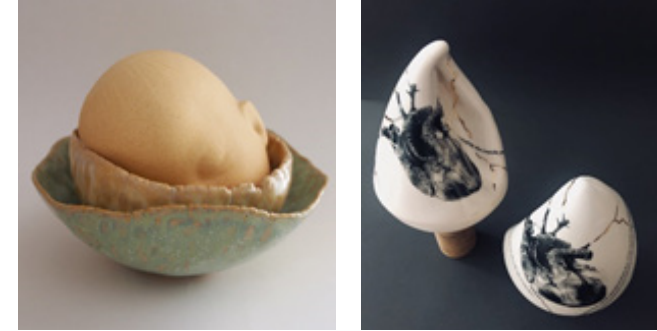
Görsel 13. Olgu Sümengen Berker, "Çözülme", 2014, limonges porselen, 21 cm x 21.50 cm x 67 cm. (Üstte Solda)