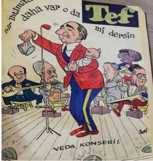
Şekil 10: Tef Kapak

sözlerin kolayca tamamlanabileceği aşıkardır (Tef, c.1, s.24, 1960: Kapak). Sayı 28'de yayınlanan başka bir kapak karikatüründe Menderes “ Kazasız belasız 1961 yılını da idrak ettik arkadaşlar, daha nice yıllara ” diyerek kadehini bunun şerefine kaldırmaktadır (Tef, c.2, s.28, 1960: Kapak).