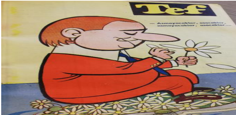
Şekil 9. Asacaklar, Asmayacaklar

Sayı 9'da yayınlanan kapak karikatüründe Menderes “ Asmayacaklar, asacaklar, asmayacaklar ” şeklinde papatyadan fal tutmaktadır (Tef, c.1, s.9, 1960: Kapak).