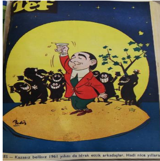
Şekil 11: Tef Kapak