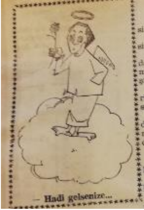
Şekil 12. Hadi gelsenize

şöyledir: “ Bunların işleri uzadı, beklemekten bıktım. Tekrar intihar ediyorum ” (Tef, c.1, s.21, 1960: 5).