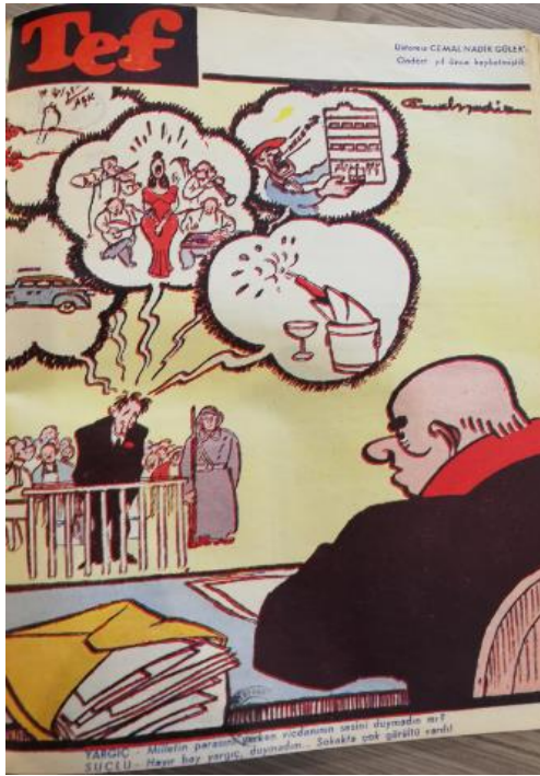
Şekil 18. Tef Kapak