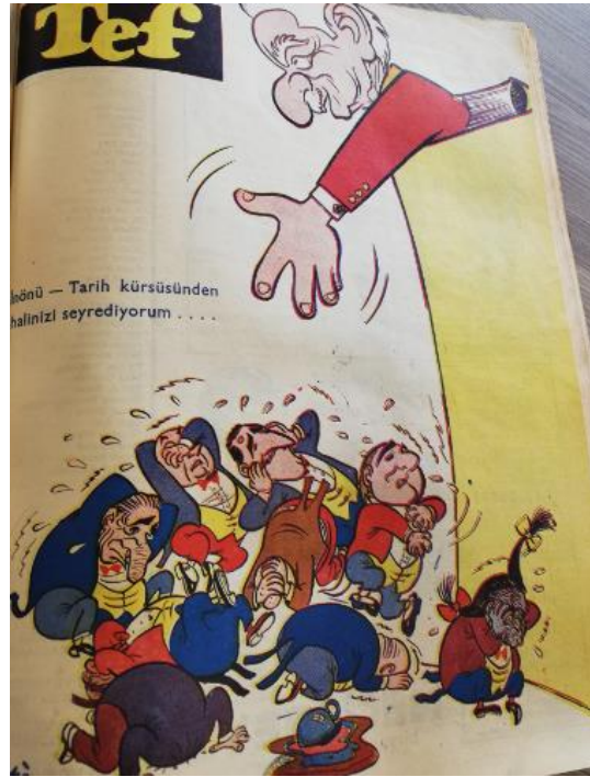
Şekil 19. Tef Kapak

Kaynak: (Tef, c. 2, s. 37, 1961: Kapak).