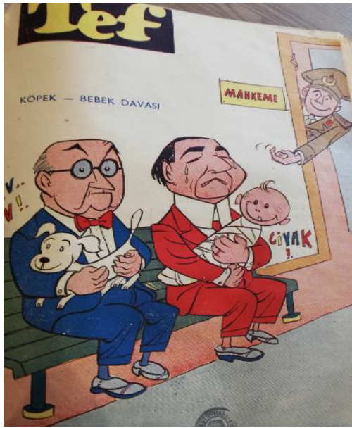
Şekil 16. Tef Kapak

Yassıada'da duruşmalara 14 Ekim 1960'da başlanmış, kararın açıklandığı 15 Eylül 1961'e kadar geçen 11 ay 1 gün içinde toplam 592 sanık hakkında 19 ayrı dava açılmıştı. Yassıada davaları; ağır ceza, siyasi ve yolsuzluk davaları olmak üzere 3 ana grupta 20 toplanıyordu (Yücel, 2001: 163-165). 14 Ekim'de görülmeye başlayan Köpek davasında Celal Bayar ve eski Tarım Bakanı Nedim Ökmen, Afganistan Kralı tarafından Bayar'a hediye edilen bir Afgan tazısını zorla hayvanat bahçesine satmaktan; 31 Ekim'de Menderes de gayri meşru çocuğunu öldürmeye azmettirmek suçundan yargılanmıştı. 21 Sayı 19'da Köpek davası ve Bebek davasını kapağına taşıyan Tef, mutluluktan gülümseyen bir mübaşir tarafından mahkeme salonuna çağrılmaktadır. "Menderes'in suçlarına ait yeni vesikalar bulundu" alt yazısı ile Mıstık tarafından çizilen başka bir karikatürde Menderes: yolsuzluk, suiistimal, hırsızlık vesikalarıyla görülmektedir (Tef, c.1, s. 4, 1960: 6).