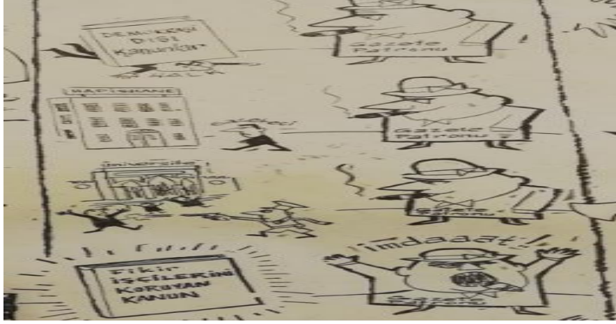
Şekil 21: Tef