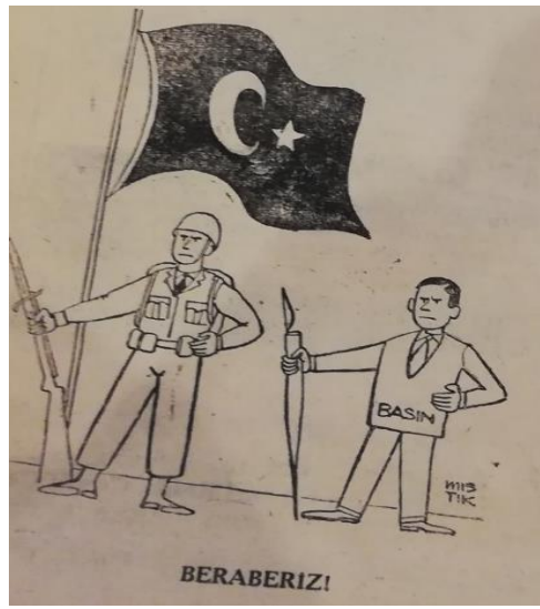
Şekil 5. Beraberiz