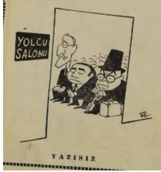
Şekil 8. Yazısız