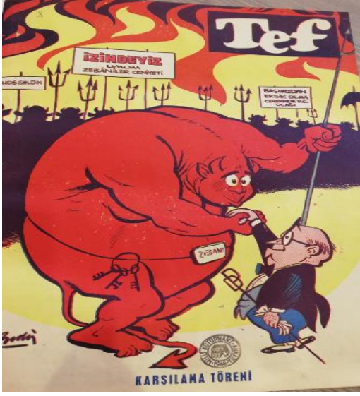
Şekil 7. Tef