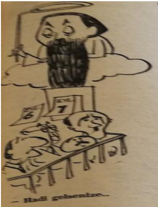
Şekil 14. Hadi Gelsenize