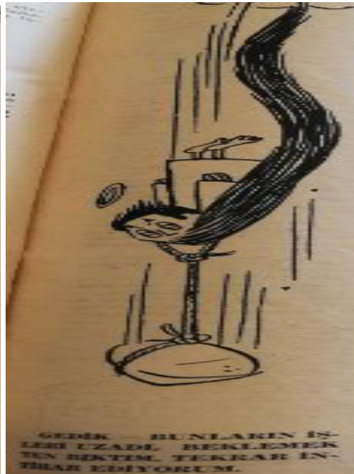
Şekil 15. Gedik...