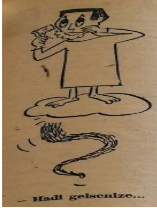
Şekil 13. Hadi Gelsenize