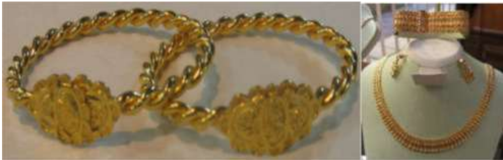
Şekil 7. Çeyizlerde yer alan Erzurum burması ve fantezi set takımı

Takı, halk dilinde çoğunlukla evlenen veya nişanlanan birine armağan edilen küpe, bilezik, yüzük gibi şeylerin tümü olarak tanımlanmaktadır. Takı, yapımında gelenek ve inançların önemli rol oynadığı, çoğu zaman madenden yapılan ve taşlarla süslenen, çoğunluğunu kadınların süslenmek amacıyla kullandıkları özel parçalardır (Anonim, 1970: 849). Diğer el sanatlarında olduğu gibi, takılarda da çeşitli desen ve motiflerden yararlanılarak süslemeler yapılmaktadır. Bu süslemeler genellikle maden süsleme teknikleri sonucu ortaya çıkmakta çeşitli taş ve boncuklar bu süslemeleri tamamlamaktadır (Özbağı, 1989: 27). Erzurum çeyizlerinde bulunan çeşitli takı örnekleri Şekil 7’de yer almaktadır