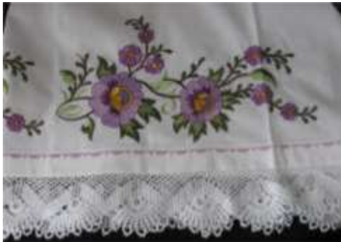
Şekil 19. Kum işi yastık kılıfı

Sosyo-kültürel yapıda meydana gelen değişiklikler Türk kültürünün her safhasına yansıdığı gibi çeyiz kültüründe de gözle görülür farklılaşmalara neden olmuştur. Eskisi gibi birlik oturma - erkeğin anne, baba ve ailesi ile- adetinin ortadan kalkmasıyla birlikte kurulacak olan evin eşyalarının dizilmesi ve hazırlanmasında çeyiz olgusunun ne denli önemli olduğunu ortaya koymaktadır. Özellikle Erzurum’da yeni kurulacak evin eşyalarının büyük kısmını kız tarafı hazırlamaktadır. Eğer kız okumuş ve eline ekmeğini almış ise ailesine yük olmadan tüm eşyasını kendi satın almaktadır. Mutfak eşyası, elektronik beyaz eşya, yatak odası ve sandık eşyasını bizzat kızın kendisi tamamlamaktadır.