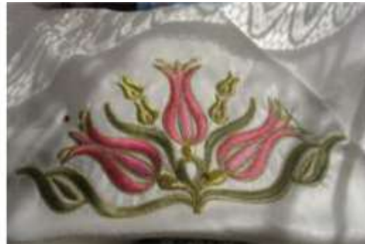
Şekil 20. Sarma işi bohça

Eskiden el dokuması olan halı kilimlerin yerlerini makinede dokunmuş yaygılar almış, bakır kap-kaçakların yerini porselenler, elektronik eşyalar; dantel, işleme, örgüler sadece sandıkta kalarak yerlerini mefruşat ürünlerine bırakmıştır. 1960’lardan sonra dikiş makinelerinin