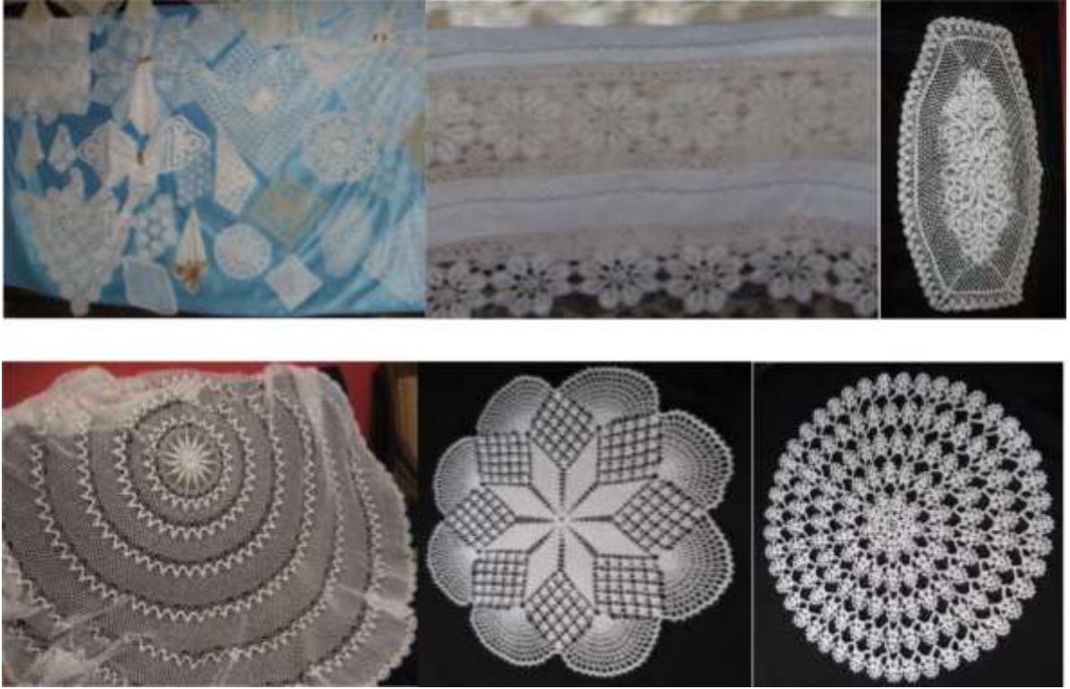
Şekil 1. Çeyizlerde yer alan tentene (dantel) örnekleri

İnce örgüler grubunda incelenen tentene (dantel), elbise, çamaşır, örtü vb. eşyalara süs olarak dikilen ve çeşitli ipliklerle değişik biçimde örülen seyrek dokuma olarak tanımlanmaktadır. Halk dilinde dantele tentene de denilmektedir (Eronç, 1984: 108). Tenteneler (dantel), her yöre ve çeyizlerde olduğu gibi araştırma kapsamına alınan yöre çeyizlerinin de en önemli el işleridir. Hem objeyi süsleyen hem de objeyi oluşturan tenteneler olarak ta; yatak odası, vitrin (salon), oturma odası takımları, sehpa takımı, mutfak takımı, yastık başı ve masa örtüleri şeklinde karşımıza çıkmaktadır. Perdeler ve fiskos örtülerinde de motif tentenelerin yanı sıra tümenden örülen tentenelere de rastlanılmaktadır. Ara tenteneler ise karyola takımları, yorgan ağzı ve yastık kılıflarında kullanılmaktadır. Ayrıca uç tentenelerini de hemen hemen tüm ürünlerde görebilmek mümkündür. Erzurum çeyizlerinde bulunan çeşitli tentene örnekleri Şekil 1’de yer almaktadır.