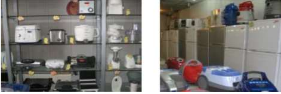
Şekil 11. Çeyiz dükkanlarında yer alan çeşitli beyaz eşyalar