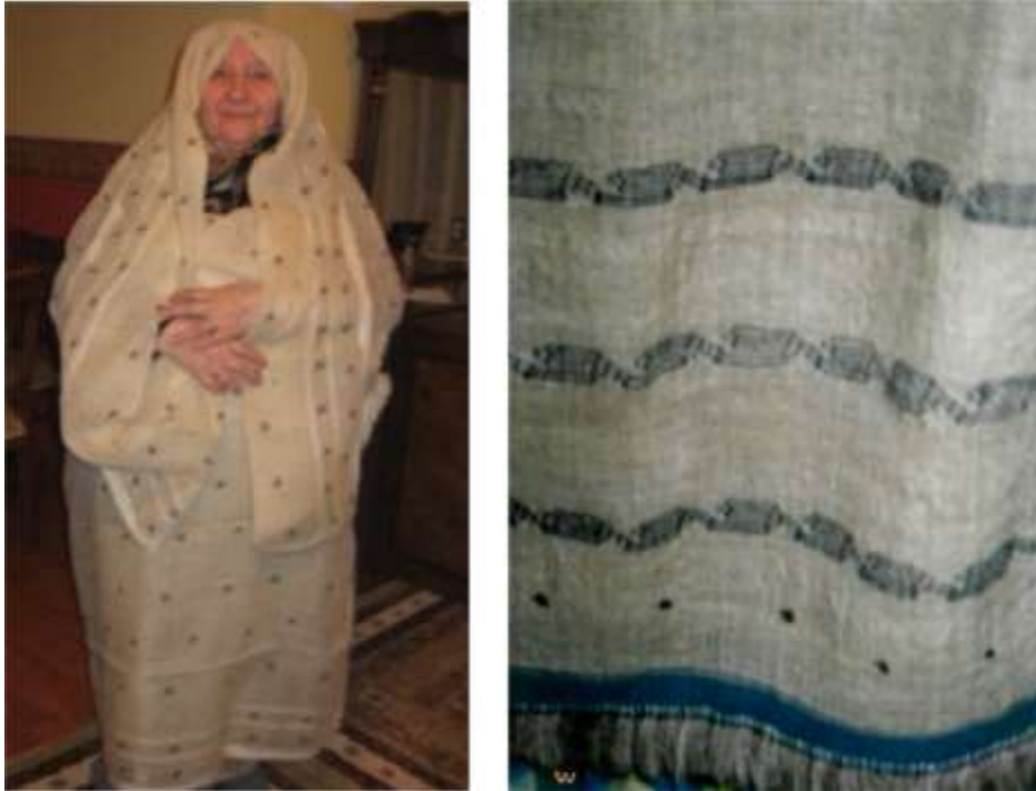
Şekil. 4. Çeyizlerde yer alan çeşitli ehram örnekleri