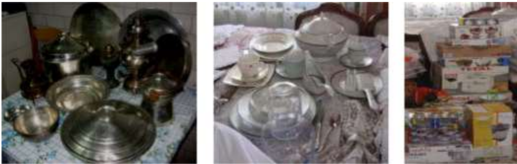
Şekil 10. Çeyizlerde yer alan çeşitli mutfak eşyaları

Araştırma kapsamına alınan kaynak kişilerle yapılan görüşmeler sonucunda yörede eskiden; toprak güveç, bakır teşt, bakır semaver, soba kazanı, gaz ocağı, bakır sini, abdest ibriği, bakır tencereler, pilav tenceresi, serpuşlu (kapaklı) sahan, büyük bakraç, güğüm, bakır maşrapa, sütlaç tasları, börek tepsileri, hususi misafir sinisi (bu sinilerin kenarları kırmalı süslü olurdu), yağ yamağı bir kızın çeyizinde olması gereken eşyalar arasında yer almaktaydı. Günümüz çeyizlerinde ise gelişen ve değişen hayat şartlarına bağlı olarak bu bakır eşyaların yerini artık alüminyum-çelik tencere ve tavalar, porselen yemek takımları almış durumdadır. Eskinin bakır eşyaları ise günümüzde şark köşelerinde veya vitrinlerde süsleyici unsur olarak görülmektedir. Erzurum çeyizlerinde bulunan çeşitli mutfak eşyaları Şekil 10’da yer almaktadır.