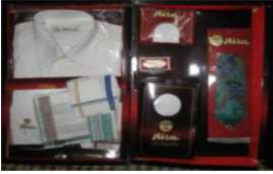
Şekil 12. Şeker başı için hazırlanan kıyafetler