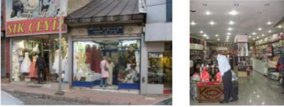
Şekil 18. Çeyiz mağazaları

malzemeler; dantel ve iğne oyali havlu kenarları, kenarları iğne oyası yapılmış yazmalar, dantel örtülerdir. Bu tür mağazalardan alışverişi genellikle ya düğünü yakın olup hazırlığı olmayan aileler ya da kendisi yapmaya bilmeyenler tercih etmektedirler. Ancak çarşı pazar işi olarak tabir edilen bu eşyalar, geleneksel kesimde pek rağbet görmez (Bahşişoğlu, 1998: 75). Şekil 18’de Erzurum’daki çeyiz mağazaları görülmektedir.