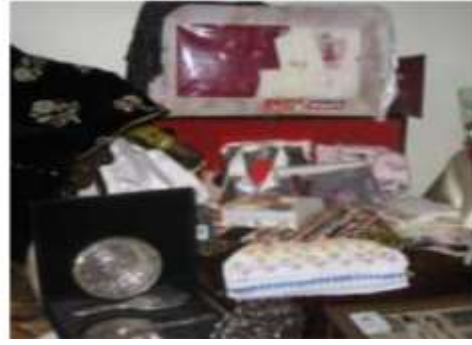
Şekil 13. Çeyizde sergilenen hamam takımı