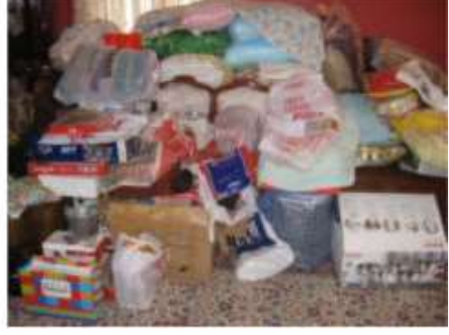
Şekil 16. Toplanmış çeyiz eşyaları

Erzurum’da çeyiz dağıtma işi özel bohçalar hazırlanarak yapılır. Müjde yastığı, sağdıç bohçası, kayınvalide (kaynana)-kayınpeder (kaynata) bohçası ve hediye bohçaları şeklinde hazırlanır. Müjde yastığı, aslında damat bohçasıdır. Kuran-ı Kerim, ayna, yastık, traş takımı, pijama takımı, terlik, ayakkabı, iç çamaşırı, kravat, kravat iğnesi, gömlek, kol düğmesi, lif, el havlusu, parfüm seti, seccade, namaz takkesi, tespih, kemer, cüzdan gibi eşyalar olması gerekir. Sabahleyin kız, evinden davul-zurna eşliğinde oyunlar ve barlar oynanarak çıkarılır. Kız evinden “müjde yastığı” oğlan evinden bir kişiye teslim edilir. Bu, kızın artık baba evinden çıkmış olduğu manasına gelmektedir. Sağdıç bohçasına ise pijama takımı, terlik, gömlek, kravat, çorap, erkek iç çamaşırı, el havlusu, seccade, namaz örtüsü, bayan iç çamaşırı, bayan çorabı, lif, çarşaf takımı ya da karyola takımı koyulur. Müjde yastığı, düğün sabahı oğlan evine teslim edilirken sağdıçın bohçası da verilir