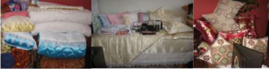
Şekil 9. Çeyizlerde yer alan yatak-yorgan-yastık-minderler

yasdığı, minderini yapar. Odduz kilosıyan döşşegini doldurur, beş kilosıyan mitilini (yorgan) töktürirdi. Mahallede bu işi beceren biri varsa ona yoksa bat pazarındaki hallaçlara döktürülirdi” şeklinde ifade etmiştir. Şekil 9’da, Erzurum’da bir çeyiz sergisindeki yatak takımları, yorganlar, yastık ve minderler görülmektedir.