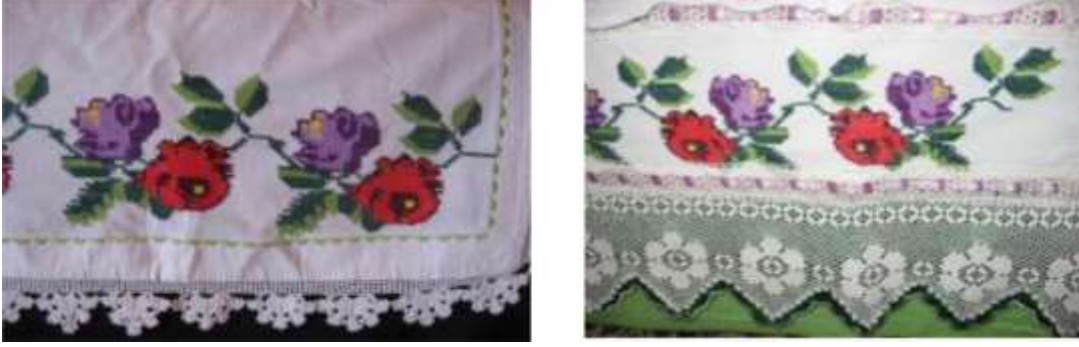
Şekil 21. Kanaviçe örtünün pike takımı olarak değerlendirilmesi

yaygınlaşması hatta son yıllarda da bilgisayarlı makinelerin icadıyla yapılan işlemler sanat eseri olmaktan çıkmış, seri üretimle ticari kaynak haline gelmiştir. Şekil 19'da bilgisayarlı makinede yapılmış kum işi yastık kılıfı, Şekil 20'de ise sarma işlemeli bohça görülmektedir. Ayrıca eskimiş ya da yıpranmış olan işlemlerin aslı aynı kalmak suretiyle formları değiştirilerek pike takımı olarak değerlendirilmesi, son yıllarda sıkça karşılaşılan bir uygulamadır (Şekil 21). Dantel ipliklerinin naylon ve polyester olması örülen dantelleri daha pratik ve cazip hale getirmektedir. Örülmesinin ve ütülenmesinin kolay olması sebebiyle son dönem çeyizlerde neredeyse tüm danteller bu ipliklerle yapılmaktadır. Şekil 22'de naylon dantel ipliği ile örülmüş oda takımı örtüleri görülmektedir.