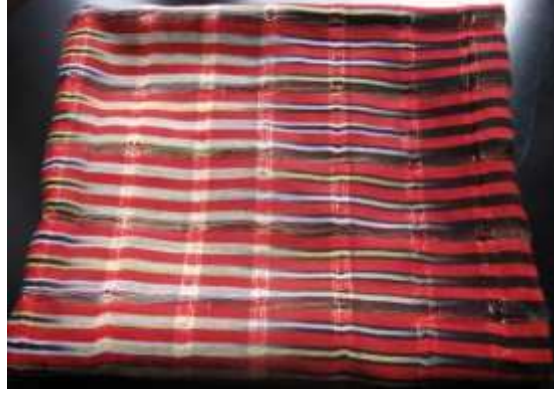
Şekil 5. Çeyizlerde yer alan keşanlı peştamal

Keşanlı peştamal; mekikli dokuma olan peştamallar, hamamlarda örtünmek amaçlı kullanılmaktadırlar. Özellikle Erzurum’da, kadınlar hamama gittikleri zaman peştamalsız hamamlara alınmamaları bir kuraldır. Bu edeptendir. O yüzden ki çeyizlerde özellikle hamam takımlarında keşanlı peştamalı görmek mümkündür. Erzurum çeyizlerinde bulunan keşanlı peştamal örneği Şekil 5’te yer almaktadır.