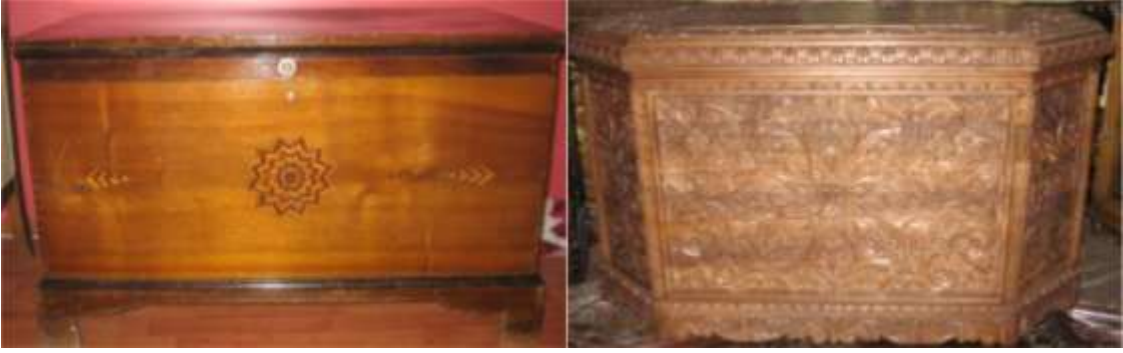
Şekil 8. Çeyizlerde yer alan sandıklar

pirinç karyola kızın çeyizi için hazırladığı kanaviçe işlemeli yatak takımları ile “gelin yatağı” olarak süslenirdi. Yaklaşık son otuz yıldır mobilyaların artması ve gelinler için ayrı ev açılmasıyla birlikte çeyizlerde mobilya alımı artmıştır. Günümüzde, eski geleneklerin devamı olarak mutfak eşyaları ve yatak odası takımını kızın ailesi almaktadır. Bunun dışında kalan diğer eşyalar ise erkek tarafınca tamamlanmaktadır. Eskiden ev yerleşim düzeninde ana kural odanın ya da evin herhangi bir bölümüne boşluğun ve yalınlığın hakim olmasıdır. Bu sadelik arayışında, ihtiyaçtan fazlasını israf kategorisine sokan İslam’ın eşyaya bakışının tesiri de çok önemlidir. Yörede de yatak ve oturma odasının tüm eşyasını kız evi yapmaktadır. Oğlan tarafı ise sadece salon takımını satın almaktadır. Sandık, içerisine çeşitli eşyaların yerleştirildiği, tahtadan yapılan, dört köşe ve dikdörtgen kapaklı ev eşyasıdır. Elbise sandığı, araç sandığı, kitap sandığı gibi (Tatar, 2001: 34). Ağacın hammadde olarak değerlendirildiği el ürünlerinden biridir, sandık. İçlerine başta çehiz olmak üzere değerli kumaşlar, bohçalar vb.nin korunduğu fonksiyonel eşyalardır (Çetintaş, 1998: 264). Erzurum çeyizlerinde bulunan çeşitli sandık örnekleri Şekil 8’de yer almaktadır.