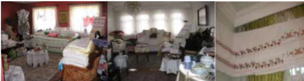
Şekil 14. Erzurum iline ait farklı çeyiz sergileri

Yörede ise kız tarafı düğün gününe kadar gerekli tüm hazırlıkları yapar. Kızın kendi evinden getireceği çeyizler tamamlanır. Düğüne 15-20 gün kala kızın çeyizi bir odada sergilenir. Bu işleme “çeyiz asma” denir. Kızın çerezini (hediyelerini) alan tüm komşular, kızın yakınları çeyizi görmeye giderler giden her kişi bir takım hediyeler götürür. Bu hediye verme işlemine “saçı götürme” adı verilmektedir. Şekil 14’de Erzurum’a ait çeyiz sergileri görülmektedir.