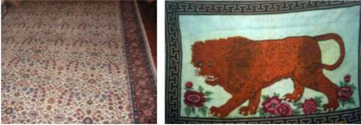
Şekil 6. Çeyizlerde yer alan Hereke halı ve Bardız kilimi örneği