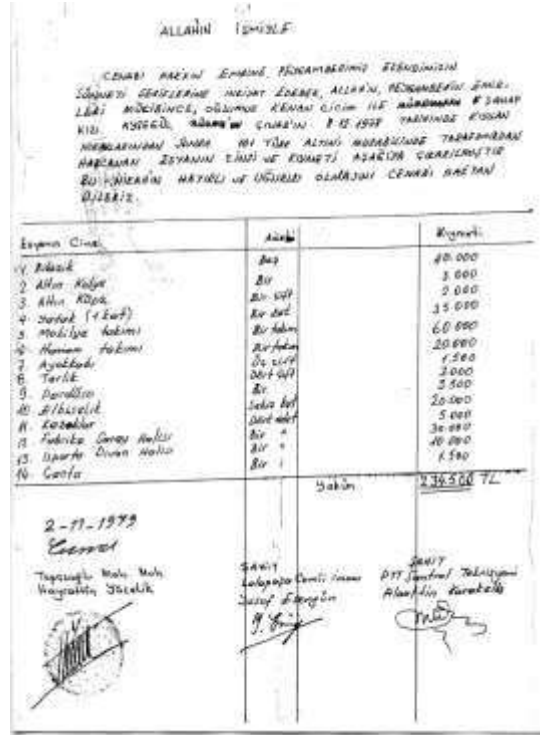
Şekil 15. Mehir defteri