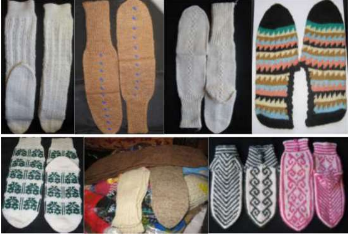
Şekil 3. Çeyizlerde yer alan çeşitli çorap ve patik örnekleri

Yörede kışın uzun ve ağır geçmesi çeyizlerde de buna uygun mamullerin talep edilmesine sebep olmuştur. Dağ çayırının fazla olması hayvancılığı ön plana çıkarmış, iklim koşullarından dolayı da yünün kullanılmasını önemli kılmıştır. Erzurum çeyizlerinde yün çoraplar her zaman değerini korumuştur. Koyunyünün kırkımından elde edilen yapağılar, yıkanıp temizlendikten sonra yün çubuğu ile çırpılır. Yün tarağından geçirilerek sümek haline getirilip, teşilerle de eğrilerek iplik elde edilir. İnce bükümlü ve doğal yün renginden örülen bu çoraplar, çeyizlerin en nadide ürünleridir. Yün çorapların yanı sıra yörede orlon ipliklerden örülen "spor" ve "patik (yörede paddik şeklinde ifade edilmektedir)"lere de rastlanılmaktadır. Araştırma kapsamında "dizleme" diye ifade edilen çoraplar tüm çeyiz sandıklarında yer almaktadır. Saf yünden ve bizzat yünün doğal renginden örülmektedir. Erzurum çeyizlerinde bulunan çeşitli çorap örnekleri Şekil 3'de yer almaktadır.