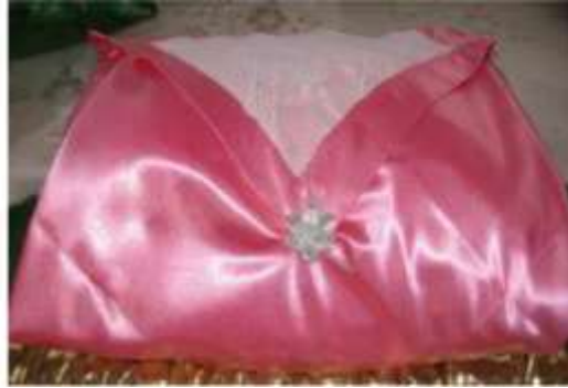
Şekil 17. Damat ve sağdıç bohçası