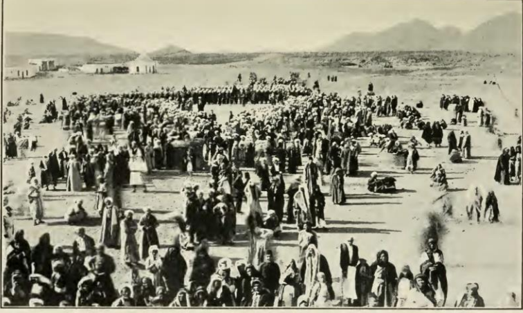
TURKISH TROOPS ON THE MARCH.

Ek 4: Hicaz'da Türk Askerleri (Sultan Cihan Begüm, The Story Of Pilgrimage To Hijaz , Calcutta 1913, s. 242.)