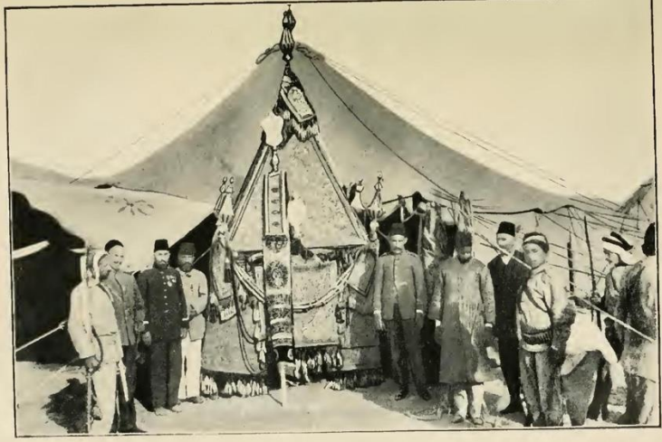
MAHMİL SHAREEF (SACRED EQUIPAGE).