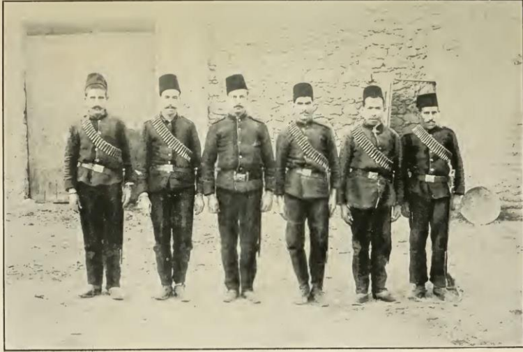
A GROUP OF TURKISH SOLDIERS OF THE IRREGULAR FORCE.

Ek 5: Hicaz'da Bir Grup Türk Askeri (Sultan Cihan Begüm, The Story Of Pilgrimage To Hijaz , Calcutta 1913, s. 254.)