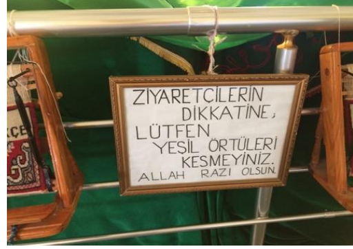
Görsel: 2 Ali Osman Efendi Türbesindeki Uyarı