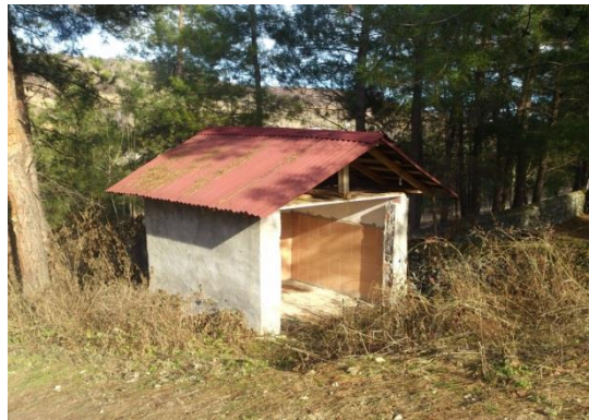
Görsel: 6 Doğan Şah Türbesi Kurban Kesme Bölümü