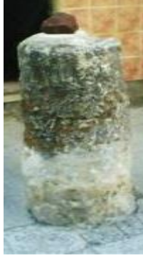
Görsel: 1 Keçeci Baba Türbesi'nde Bulunan Taş