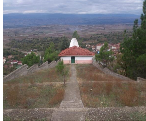
Görsel: 4 Mehmed Dede Türbesi