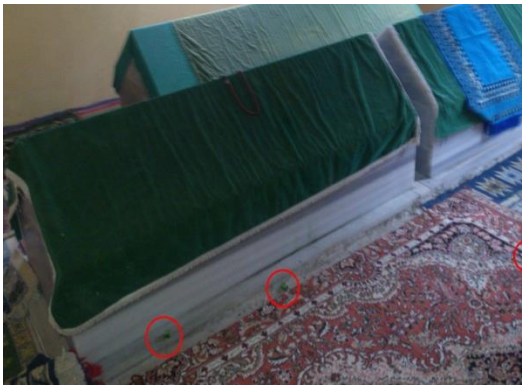
Görsel: 5 Hüseyin Gazi Türbesi ve Yerdeki Şekerler