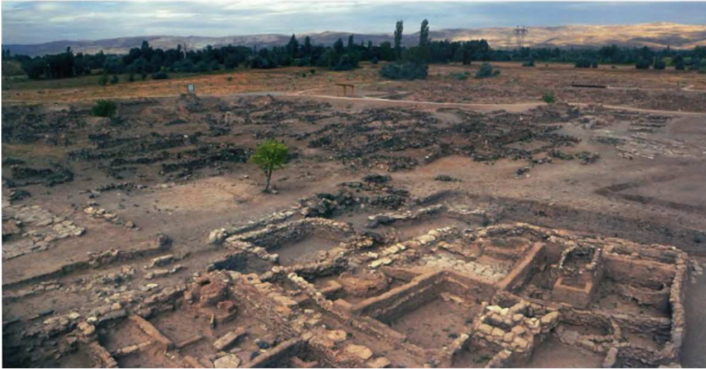
Resim 3. Kültepe/Kaniş'in Genel Görüntüsü (Larsen, 2010: 81).

Kaniş kārum 'u Asur ile Anadolu arasındaki haberleşmeyi sağlayarak Asur Devletinin Anadolu'da ki temsilcisi gibi hareket etmekteydi. Kaniş kārum 'una bu görevin verilmesinin sebebi yerel krallıklara göre merkezi bir yerde olması veya Kültepe'deki yerel krallıkta siyasi ortamın güvenilir olmasından kaynaklanmış olabilir (Bryce, 1985: 260).