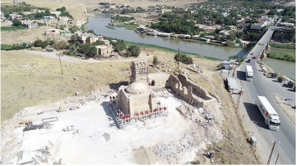
Resim 1: İmam Abdullah Camii ve Zaviyesi'nin taşıma işleminden önceki konumu.