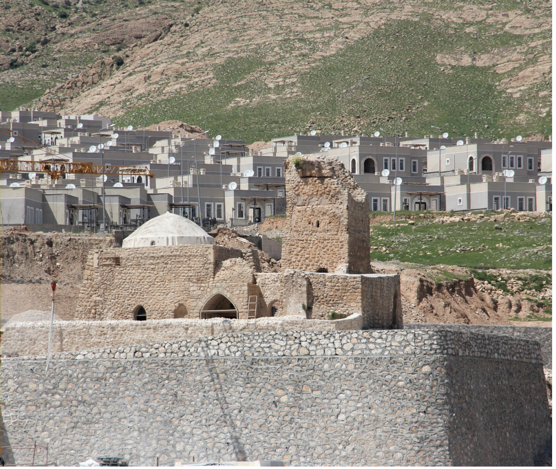
Resim 3: İmam Abdullah Camii ve Zaviyesi'nin Hasankeyf Arkeopark'taki yeni yeri.