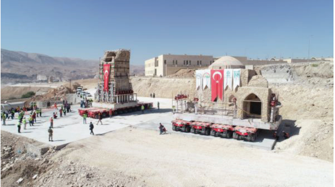
Resim 2: İmam Abdullah Camii ve Zaviyesi'nin yeni yerine taşınması