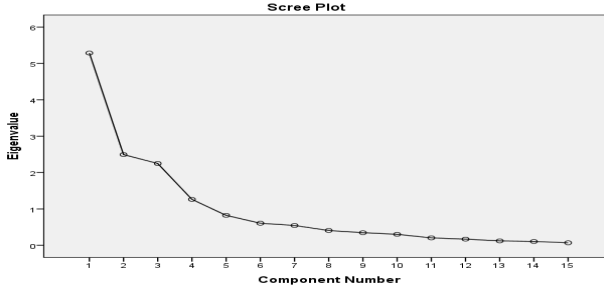
Şekil 1. ÖAHÖ Faktörlerine İlişkin Yamaç-Birikinti Grafiği

oranı dikkate alınarak yapılan analiz işlemlerinde Varimax dik döndürme tekniği ve faktör yükleri hesaplanmıştır. Maddelerin faktör yükleri .30 ile sınırlandırılmıştır.