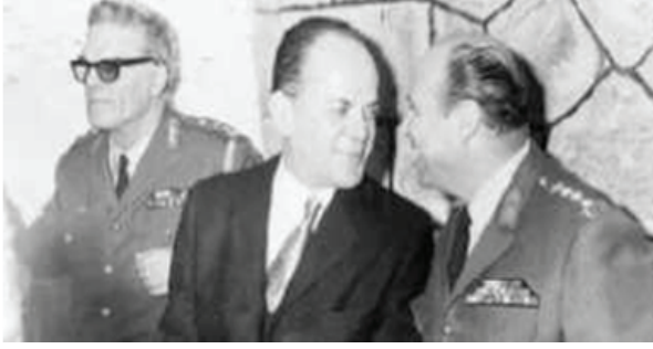
1974 Yunan Cuntası Gizikis, Papadopulos Ve Ioannides

Kıbrıs adasında barışın bozulmasına, silahlı çatışmaların çıkmasına, kan ve gözyaşının durmamasına neden olan üç kişiden ikisi maalesef Yunanlı Generaller, Mareşal Alexandros Papagos ve Yunanistan topraklarını genişletmek amaçlı Kıbrıs adasını Yunanistan'a bağlamak ve Enosis'i gerçekleştirmek için Kıbrıs'ta 15 Temmuz 1974 darbesine karar veren, Tuğgeneral Dimitrios Ioannides 'dir.