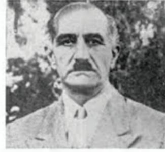
GRIVAS, George Theodorou of Nicosia, Age about 57; height 5' 6 1/2"; medium to broad build (possibly less thickset than indicated in photograph); strong broad face, small moustache; chestnut eyes; dark and bushy eyebrows; wide shut mouth with firm jaw.

Yunanistan'da seçimler iyice kızışmış ve Papagos'un seçimlerde favori olduğu ortaya çıkınca Grivas Ekim 1952 tarihinde incelemelerde bulunmak üzere adaya gelmiş ve Şubat 1953 tarihine kadar tam beş aya yakın bir süre Kıbrıs'ta kalarak İngilizlere karşı silahlı bir mücadelenin nasıl yapılabileceği konusunda incelemeler yapmıştı.