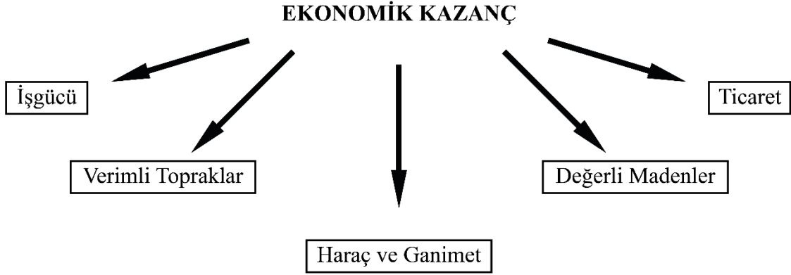
Tablo 2: Hitit Krallığı'nın Kuzey Suriye Yayılımı Sonucunda Elde Ettiđi Ekonomik Kazançlar

Hitit Devleti'nin anayurt topraklarının güvenliğine çok büyük önem verdiđi ve bu bağlamda, "güvenlik" faktörünün Hitit Devleti'ni, yayılıma iten bir unsur olduđu sonucu ortaya çıkmaktadır. Hurri tehlikesi bu unsurun Kuzey Suriye'deki içeriđini oluřturmaktadır.