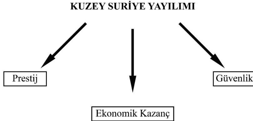
Tablo 1: Hitit Krallığı'nın Kuzey Suriye Yayılımının Nedenleri

Bu unsurların her birinin açılımı, Hitit Devleti'nin hem siyasi hem de ekonomik yapısı için çok önemli kazançları içermekteydi. "Ekonomik Kazanç" olarak tanımladığımız unsur, Kuzey Suriye'deki iç dinamiklerle bağlantılı olarak, buraya yapılan seferlerden doğrudan elde edilen getirileri bünyesinde barındırmaktadır. Aşağıdaki şemada, Hitit Devleti'nin Kuzey Suriye seferlerinden elde ettiği ekonomik kazançlar konu başlıkları halinde verilmiştir: