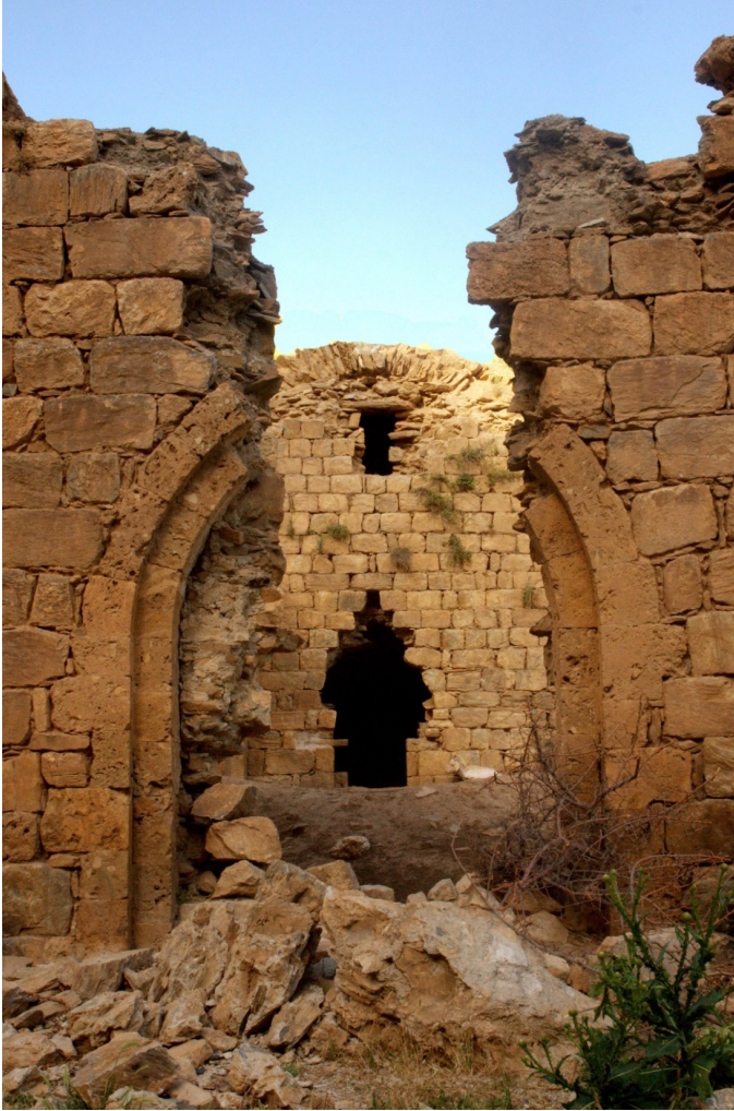
Fotoğraf 11: Saintes Femmes (Azize Kadınlar Manastırı)

Saintes Femmes (Azize Kadınlar Manastırı): Bahçesaray ilçesinin 8 km güneybatısında Elmakaya köyünün yakınında yer almaktadır. Manastırın yakınındaki su kaynağının kenarında bulunan haç işlemeli bir taş üzerine bir dua metniyle birlikte 1255 ya da 1555 tarihi kazanmıştır. Kilisenin mimari özelliklerine bakılarak inşa yılının 12-13. yüzyıllar arasında olduğu tahmin edilmektedir. Kilise Kutsal Haç, Aziz Jean Babtiste ve Tzayativank adlarıyla da tanınmakla birlikte ilçede Dira Meleşehi olarak bilinmektedir (VKTE, 2006: 244).