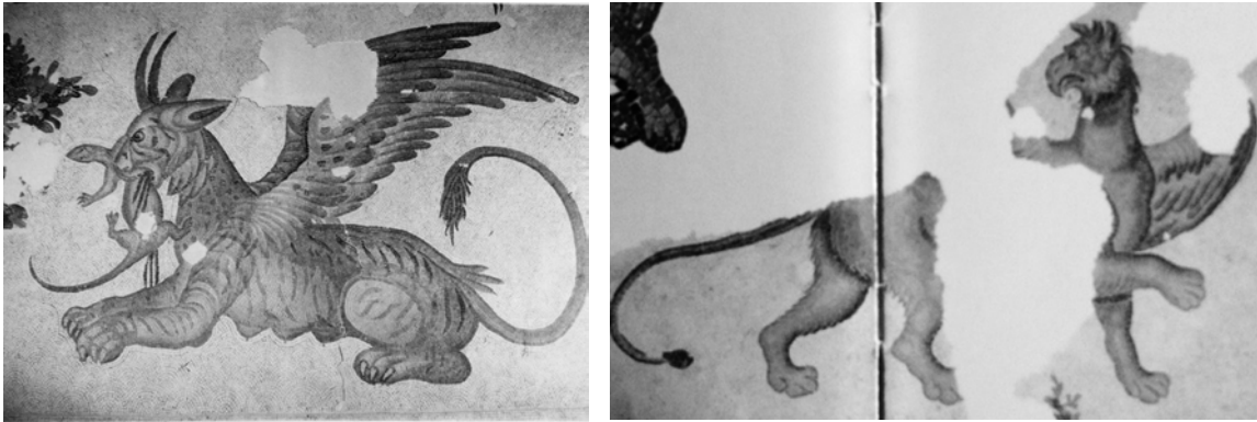
Fig. 6-7. M.S. VI. yüzyıl, İstanbul Büyük Saray Mozaik Müzesi, İstanbul (Türkiye)

İstanbul Büyük Saray Mozaikleri'nde aslan başlı grifonun yanı sıra kartal ve köpek başlı grifonlar da bulunmaktadır. Bunlardan iki grifonun başı ve kanatları kartal, gövdesi ise aslan bedenlidir. Grifonlardan biri başını arkasına çevirmiş yürür vaziyette (fig. 7), diğeri ise yakaladığı bir geyiği parçalarken resmedilmiştir (fig. 8). Bu tipteki grifonların M.Ö. III. binyıldan itibaren özellikle Ak-