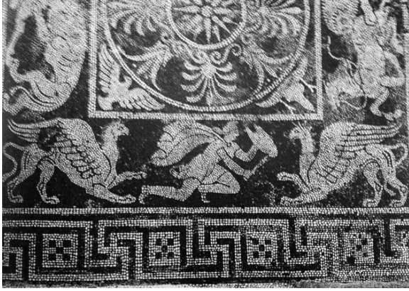
Fig. 1. M.Ö. IV. yüzyıl, Eretria (Yunanistan)

Antikçağ diğer sanat dallarında olduğu gibi mozaik sanatında da fantastik varlıkların betimlemelerine rastlamak olağan dışı bir durum değildir. Yeryüzünün en güçlü hayvanı kabul edilen aslan ile göklerin hâkimi kartalın tek bir vücutta bir araya gelmesi onu etkileyici bir görünüme sahip kılmış ve bu özelliği mozaik sanatçılarının repertuarlarında tercih edilen bir kompozisyon olmasını sağlamıştır.