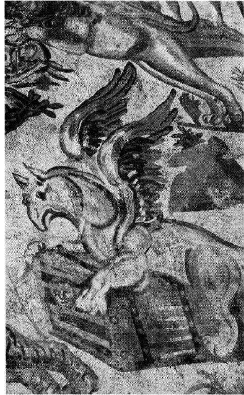
Fig. 5. M.S. IV. yüzyıl, Piazza Armerina (İtalya)

Balty'e (1997, 46) göre bu mozaikte grifonun