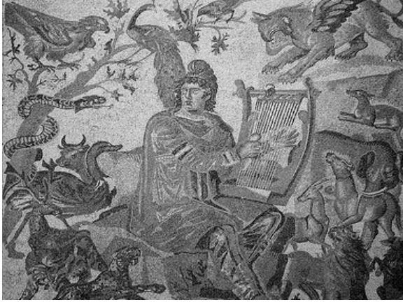
Fig. 4. M.S. IV. yüzyıl, Shahba- Philippopolis (Suriye)

nun betimlenmesinin ayrı bir anlamı vardır. Mithras kültüründe gece kızı Nemesis'in sembolü olan grifon, genel anlamda ölümü sembolize etmektedir. Piazza Armerina mozağında görülen grifonun pençeleri altında kafese saklanmış insan betimlemesi, ölümden kaçışın olmayacağı şeklinde yorumlanmaktadır 11 .