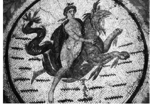
Fig. 3. M.S. III. yüzyıl, Bardo Müzesi, Sousse (Tunus)

lerdir 6 (fig. 3). Mozaikte, deniz grifonu, kartal başlı, gövde ve ön uzuvları aslan, arka uzuvları kıvrılmış balık şeklindedir. Grifonun uçuşunu yitirmiş gibi duran, gövdeye göre küçük boyutta resmedilen kanatları göze çarpmaktadır.