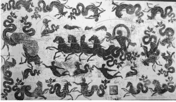
Fig. 2. M.S. II. yüzyıl, Ostia (İtalya)