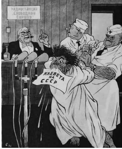
Resim 4. "Deli" Konulu Karikatür