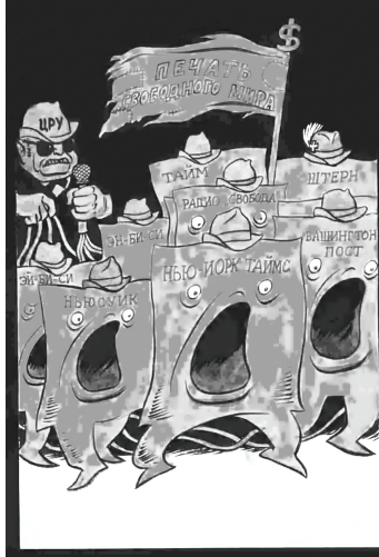
Resim 3. "Kontrol" Konulu Karikatür

Karikatürde başlarında fôtr şapkalar olan, büyük ağızlı kağıtların bir yöne doğru yürümekte olduğu aktarılmaktadır. Kağıtların hemen üstünde de "Özgür dünyanın medyası" şeklinde yazı bulunan ve tepesinde dolar işareti olan bir bayrağa yer verilmektedir. Kağıtların üzerinde "ABC, Newsweek, NBC, New York Times, Washington Post, Radio Liberty, Time, Stern" şeklinde Batı Bloku ülkelerinin, ağırlıklı olarak ABD'li yayın kuruluşlarının isimleri bulunmaktadır. Kağıtların hepsinin arkasında bir kabloya yer verilmekte, kabloların da bir mikrofona bağlı olduğu aktarılmaktadır. Karikatürde kabloların bağlı olduğu mikrofonu da siyah gözlüklü, fôtr şapkalı bir adamın tuttuğu yansıtılmakta, adamın fôtr şapkasında da "CIA" yazısına yer verilmektedir. Karikatürün arka fonu ise karanlık olarak aktarılmaktadır.