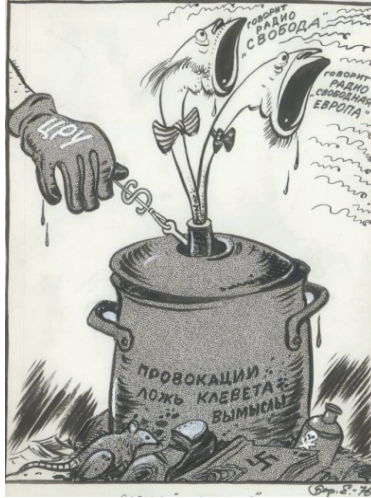
Resim 5. "Anahtar" Konulu Karikatür

Karikatürde çevresinde fare, ayakkabı, zehir şişesi ve üzerinde gamlı haç bulunan bir kitabın olduğu düdüklü tencereye yer verilmektedir. Tencerenin üzerinde "provokasyon, yalan, iftira, kurgu" yazıları bulunmaktadır. Tencerenin papyon takan iki düdüğünün olduğu aktarılmakta, karikatürde tencerenin birinci düdüğünde "Özgür Radyo konuşuyor", ikinci düdüğünde de "Özgür Avrupa Radyosu konuşuyor" yazılarına yer verilmektedir. Düdüklü tencerenin düdüklarının olduğu yere, üzerinde "CIA" yazan eldiven giymiş bir kişinin dolar işareti şeklinde bir anahtar soktuğu aktarılmaktadır.