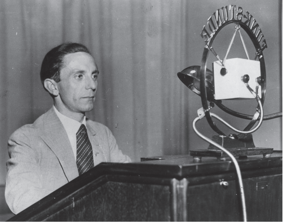
Alman Nazi politikacı ve propaganda bakanı Joseph Goebbels radyo yayını yapıyor (1897-1945)