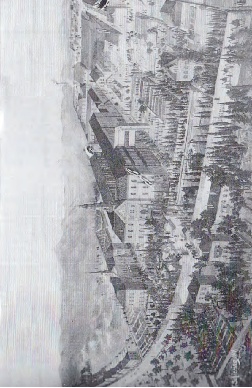
Ek 1. Suriye Yetimhanesi'nin 20. Yüzyılım başlarındaki görüntüsü.

Kaynak: Kaija Baur, M. Landgraf, Schule für Hoffnung, Zusammen Leben und Lernen von Christen und Müslimern in den Schneller-Schulen in Adhast , Lit Verlag, Berlin 2010, s. 104.