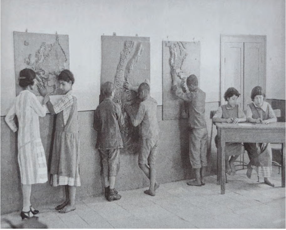
Ek 2b. Körler Okulu'nda çocukların harita çalışmasına dair bir fotoğraf.