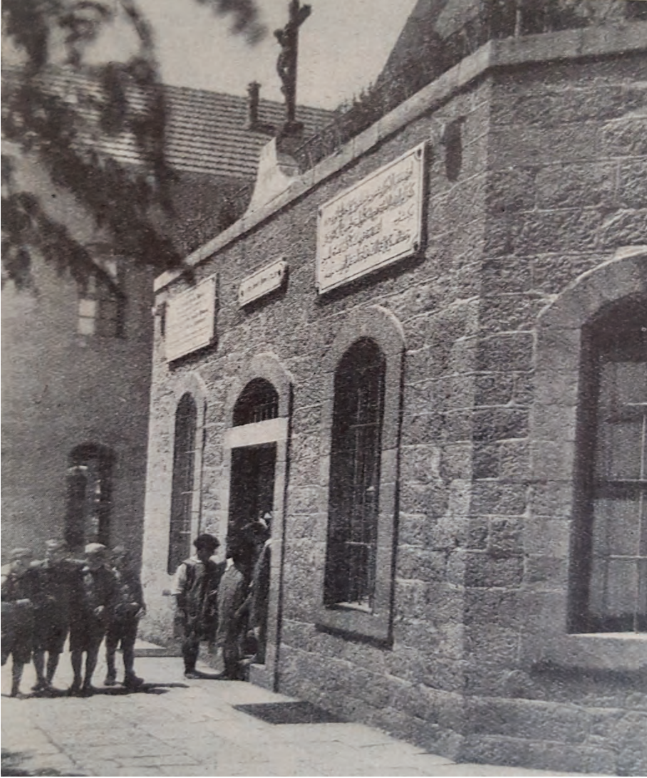
Kaynak: Hans Niemann, Ein Rundgang durch das Syrische Waisenhaus und seine Zweig-Anstalten in Heiligen Lande , Marienburg-K ln 1929, s. 32.