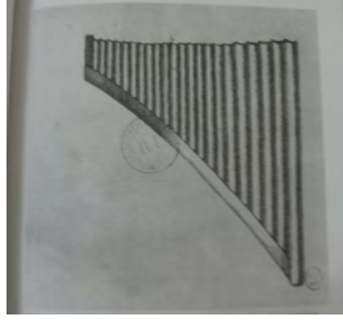
Resim 4. Miskâl Çizimi, Fonton, a.g.e. , s. 85.