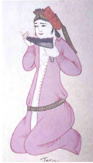
Resim 8. Miskâl Çalan Cariye, 17. Yüzyıl Çarşı Resmi, İstanbul Deniz Müzesi'nde Bulunmaktadır. And, a.g.e. , 1999, s. 73.