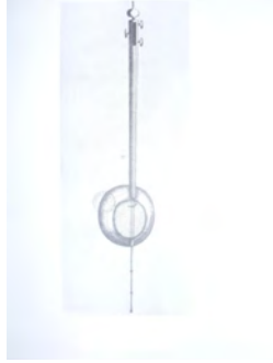
Resim 2. Keman Çizimi, Fonton, a.g.e. , s. 88