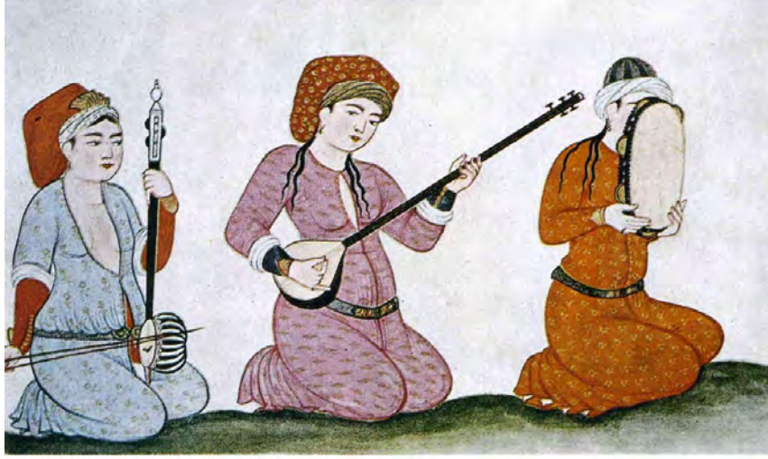
Resim 13. Üç Cariyeli Saz Takımı, 17. Yüzyıl Çarşı Resmi, Paris Bibliothèque Nationale’da Bulunmaktadır. And, a.g.e. , 1999, s. 70.