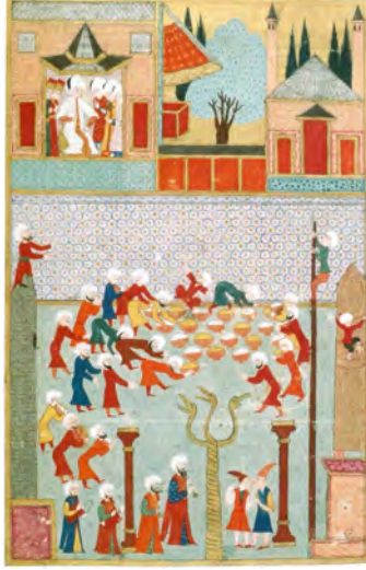
Resim 17. Kanunî Sultan Süleyman, 1530 Yılında, Dikili Taşa Tırmanân Canbâzları ve Halkın Çanak Yağmasını Seyrediyor. Hünernâme II. And, a.g.e. , 2004, s. 254.