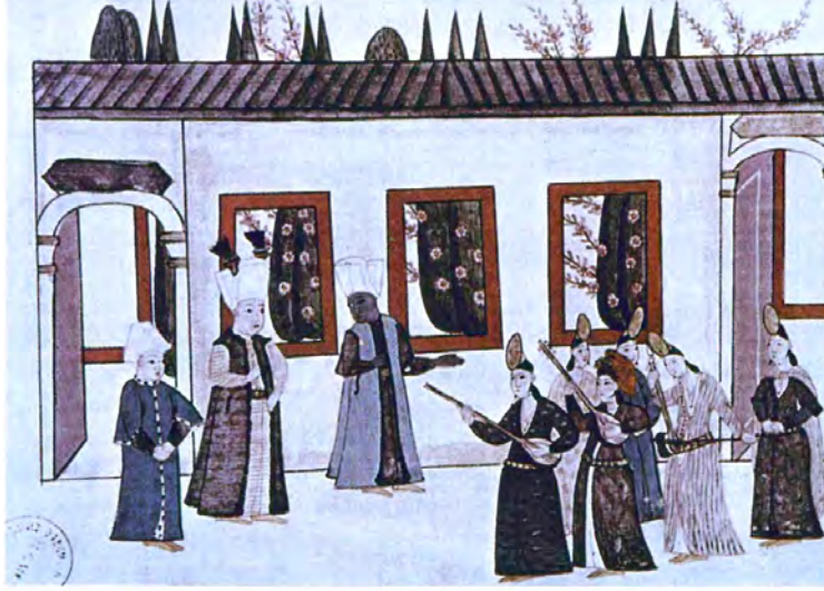
Resim 15. IV. Mehmed'in Hareme Girişinde Cariyelerin Onu Müzikle Karşılama, 17. Yüzyıl Çarşı Resmi, Venedik Museo Correr'de Bulunmaktadır.