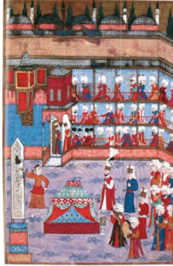
Resim 18. 1582 Şenliğinde At Meydanı'nda Kukla Gösterimi. Surnâme-i Hümayûn. And, a.g.e. , 2004, s. 257.