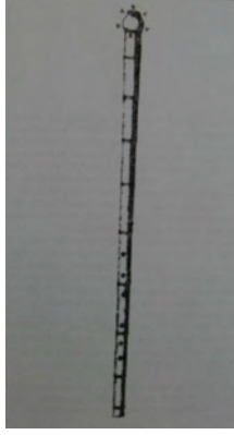
Resim 5. Ney Çizimi, Fonton, a.g.e. , s. 77.