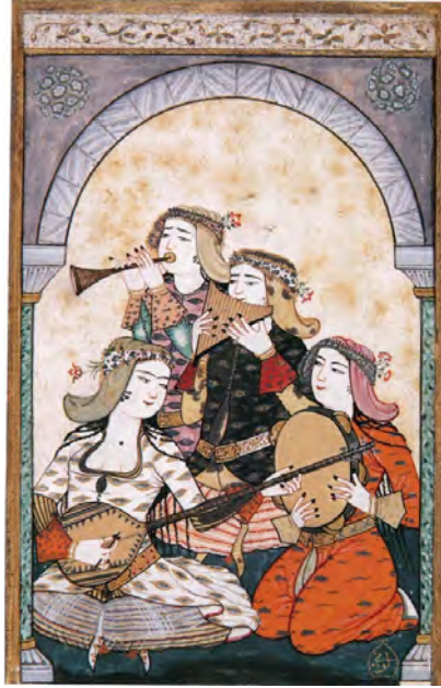
Resim 12. Çalgıcı Kadımlar, Levnî, İrepoğlu, a.g.e. , s. 199.