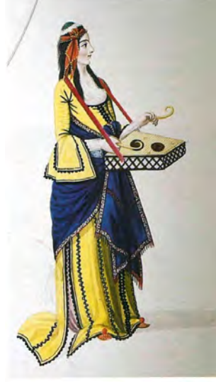
Resim 7. Santur Çalan Cariye, 19. Yüzyıl Çarşı Resmi, Ankara Etnografya Müzesi'nde Bulunmaktadır. And, a.g.e. , 1999, s. 75.