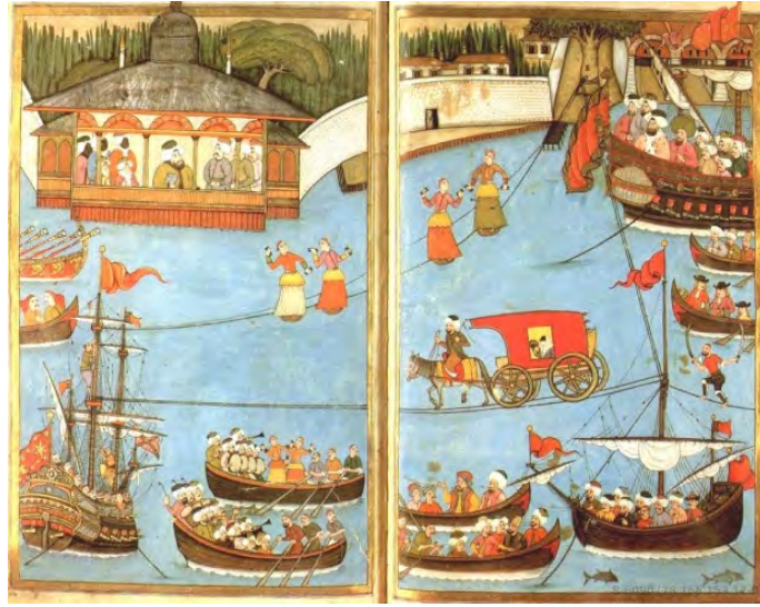
Resim 16. İp Canbâzları; Sütnâme. Sultan Ahmed'in Düğün Kitabı , Yayın Koordinatörü: Ahmed Ertuğ, Bern 2000, s. 133.