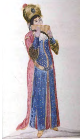
Resim 9. Miskál Çalan Cariye, 18. Yüzyıl Çarşı Resmi, Alman Arkeoloji Enstitüsü'nde Bulunmaktadır. And, a.g.e. , 1999, s. 75.