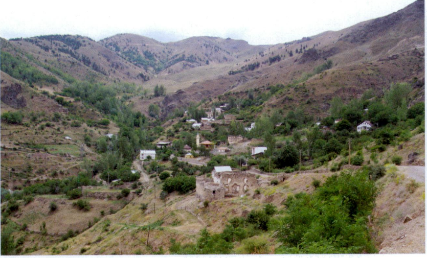
Resim 1. Eski Şehir-Canca