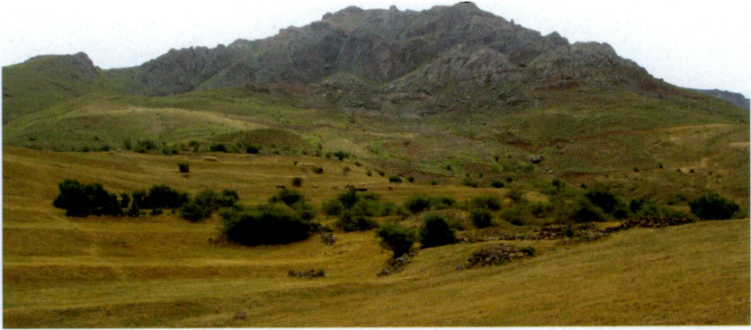
Resim 2. Kurom Maden Merkezi