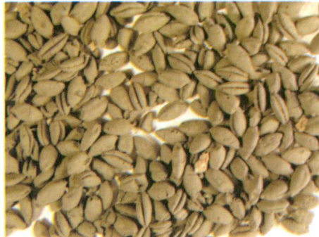
Res. 1 - Konya Karahöyük'ten Buğday Örnekleri.