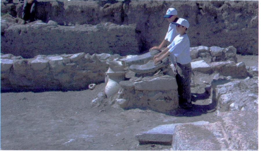
Res. 2 a,b - Kayseri-Kültepe-Kaniş/Neşa'da ortaya çıkarılmış öğütme işliğı