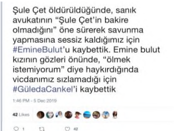
Resim 4: Tweet 3_Emine Bulut Cinayeti

Resim 3'de yer alan bir tweet, "Kadınların öldürülmediği bir dünya için hep beraber mücadeleye devam" ifadesini kullanmış, bir ay içinde 326 beğeni almış ve 101 kez "retweet" yapılmıştır.