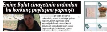
Resim 18: Sosyal Medya Ayağa Kalktı