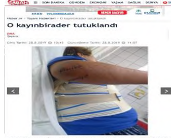
Resim 12: Saldırıda Yaralan Kadın Kaynak: Sabah Gazetesi, 28 Ağustos 2019

https://www.sabah.com.tr/yasam/2019/08/28/o-kayinbirader-tutuklandi