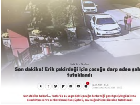
Resim 19: Erik Çekirdeği Attığı İçin Çocuğu Darp Eden Şahıs

Arabasına erik çekirdeği attığı için 11 yaşındaki çocuğu gözü dönmüşçesine darp edip ormana götürüp tecavüz etmek üzereyken orada yaşayan vicdanlı bir kadın tarafından yakalanan adam serbest bırakıldı. Ülkedeki adalet sistemi tam bir utanç tablosu.