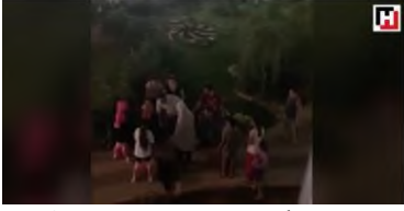
Resim 22: Çocuğa Tokat Atan Şahıs

Mersin'de geçtiğimiz Ekim ayında sokakta oynayan çocuklar arasında bir tartışma çıkmış ve Ürdün vatandaşı bir kişi 5 yaşındaki bir çocuğa tokat atmıştır. Olaya tepki veren çocuğun annesine de hakaretler yağdırmış ve üzerine yürümüştür. Yaşanan olay sonrası zanlı gözaltına alınmış ve ev hapsi cezası almıştır. Bu cezanın adil olmadığını düşünenler sosyal medyadan tepki vermişler ve bunun üzerine itiraz değerlendirilerek tutuklama kararı çıkartılmıştır.