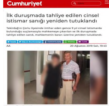
Resim 29: Çocuk İstismarcısı Olduğu İddiası ile Yargılanan Sanık