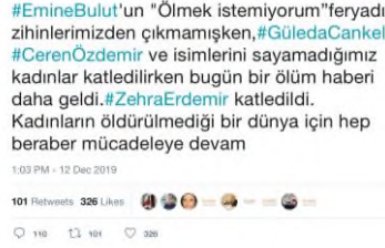
Resim 2: Tweet 1_Emine Bulut Cinayeti