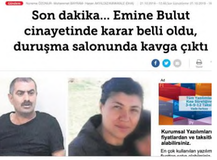
Resim 1: Emine Bulut Cinayeti Kaynak: Milliyet Gazetesi- 4 Kasım 2019

Bu haber metninde ifade edildiği gibi Emine Bulut olayı sosyal medyada çok konuşulmuş ve sanığın en yüksek cezayı almaması halinde, bu olayın toplumsal vicdanda iz bırakacağıının altı çizilmiştir. Emine Bulut cinayeti ile ilgili Twitter üzerinden yapılan çok çeşitli paylaşım ve tepkilerden birkaç tanesi aşağıda paylaşılmıştır.