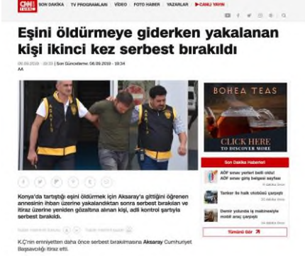
Resim 11: Eşini Öldürmeye Giderken Yakalan Şahıs

Konya’da tartıştığı eşini öldürmek için Aksaray’a gittiğini öğrenen annesinin ihbarı üzerine yakalanan ve serbest bırakılan K.Ç., sosyal medyadan gelen tepkiler üzerine tutuklandı. “Konya’da tartıştığı eşini öldürmek için Aksaray’a gittiğini öğrenen annesinin ihbarı üzerine yakalandıktan sonra serbest bırakılan ve itiraz üzerine yeniden gözaltına alınan kişi, adli kontrol şartıyla serbest bırakıldı.” ( https://www.cnntrk.com/turkiye/esi-ni-oldurmeye-giderken-yakalanan-kisi-ikinci-kez-serbest-birakildi )