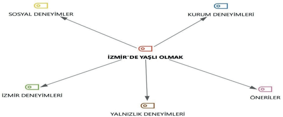
Şekil 2. İzmir'de Yaşlı Olmak MAXQDA18 Kod-Alt kod- Bölümler Modeli

Araştırmaya katılan kişilerin "İzmir'de yaşlı olmak" konusunda deneyim ve düşünceleri analiz edildiğinde karşımıza beş ana tema çıkmıştır. Bunlar yaşlıların "sosyal deneyimleri", "kurum deneyimleri", "İzmir'de yaş alma deneyimleri", "yalnızlık deneyimleri" ve "önerileridir" (Şekil 2). Bu temalar ve alt temalar bölümü Tablo 4'de ayrıntılı bir şekilde gösterilmiştir.