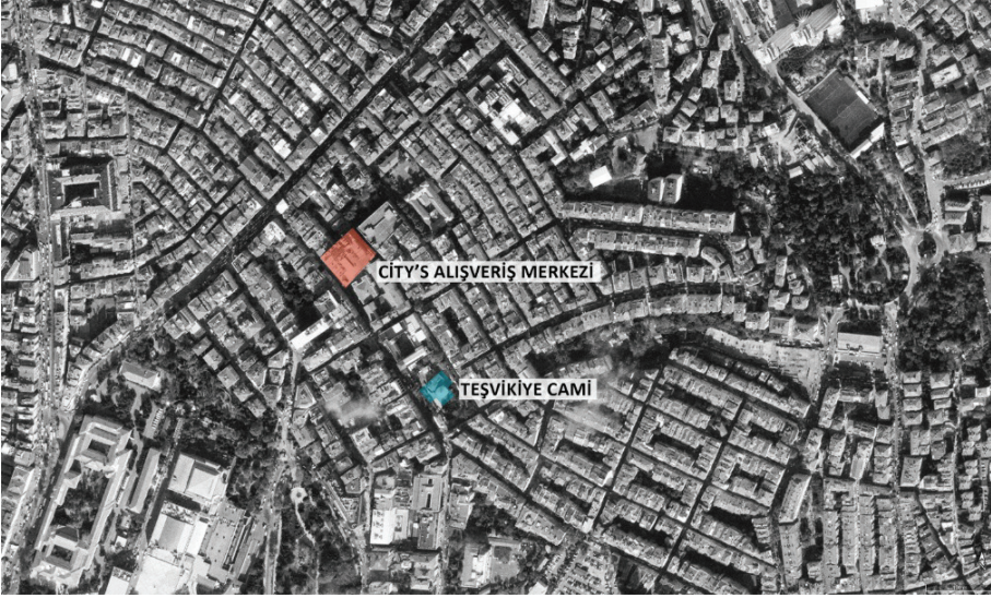
Görsel 2: City's Nişantaşı Alışveriş Merkezi'nin konumu.

City's Nişantaşı Alışveriş Merkezi, Teşvikiye Mahallesi Şişli/İstanbul'dadır. Merkez, sahibi Gülaylar Grup tarafından otuz üç yıllığına Şişli Terakki Vakfı'ndan kiralanmış bir alan üzerine inşa edilmiştir.