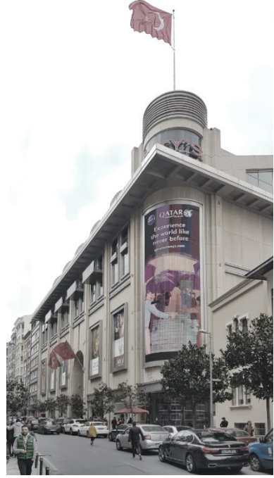
Görsel 1: City's Alışveriş Merkezi, 2019.

City's Nişantaşı Alışveriş Merkezi'nin inşa edildiği bölge, yüksek gelirli insanların ikamet ettiği ve yoğun alışveriş ilişkilerinin yaşandığı kentsel bir yerleşimdir. 20. yüzyılın ortalarından bu yana "esnaf kültürüne" dayalı ticaret anlayışı gelişmiş, hâlihazırdaki dükkânlar ve sosyalleşme mekânları, 2008 yılında açılan bu alışveriş merkeziyle farklılaşmaya başlamıştır. Ayrıca alışveriş merkezindeki ticari mağazaların çeşitliliği, yüksek gelirli kullanıcıların yanında orta gelir düzeyindeki kullanıcıları da çekmiş ve bu nedenle tüm bölgede kullanıcı yoğunluğu oldukça artırmıştır. Bunun sonucunda meydana gelen otopark sorunu, trafik yoğunluğunda yaşanan ciddi artışla beraber, büyük bir karmaşaya dönüşmüştür. Bölgede meydana gelen otopark problemi sadece bu merkez için yapılan bodrum kat otoparklarıyla çözüme ulaştırılmaya çalışılmıştır. Buna rağmen otopark kiralari, gerek dükkân sahipleri gerekse kullanıcı açısından büyük sıkıntılar doğurmuştur.