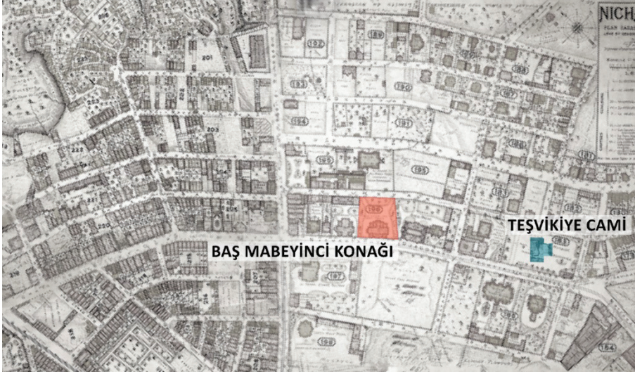
Görsel 3: Jacques Pervititch'in 1924 Nişantaşı Kadastral Planı'ndan detay. (Pervititch, 1924)

Yıkılan konağın yerine, yine eğitim amaçlı kullanılacak olan bir yapı inşa edilmiştir 13 . Vakfın eğitim faaliyetlerini başka yapılara kaydırmasıyla boşalan bu eğitim yapısı da yıkılarak, arazisi 1994-2005 tarihleri arasında otopark olarak kullanılmıştır. 2005 yılında arazi 1/5000 imar planında okul alanı olmaktan çıkarılıp, turizm-ticaret alanı ilan edilmesinden sonra, Gülaylar Grup tarafından otuz üç yıllığına kiralanarak City's Nişantaşı alışveriş merkezi inşa edilmiştir 14 .