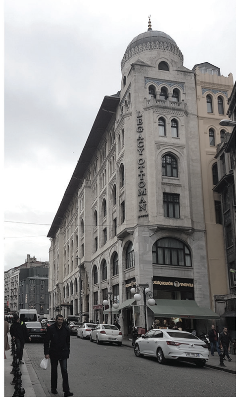
Görsel 6: Solda: City's Aışveriş Merkez, 2019. Sağda: Kemalettin Bey'in 1912-1926 yılları arasında inşa edilen 4. Vakıf Han yapısı, 2019.

İkinci Milli Mimari Akım ya da anıtsal görünüşü nedeniyle Milli Monumental Mimari 28 olarak adlandırılan dönem, çeşitli nedenlerle, 1930'larda genel olarak dünyada ortaya çıkan milliyetçi eğilimlerin ülkemizdeki yansımalarındandır. Bu süreçte dünyada yaşanan ideolojik içe dönme eğilimleri Türkiye'de karşılık bulmuştur.