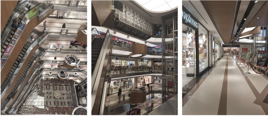
Görsel 4: City's Alışveriş Merkezi İç Mekan Görselleri, 2019.

“...Şehrin en değerli yapı adası üzerinde ve bu yoğunluktaki bir yerleşimle, istekleri ve projenin doğasını bir araya getirdiğinizde, bir de bunun üzerine kendi gerçekleştirmek istediklerinizi koyduğunuzda ortaya oldukça zor bir denklem çıkıyordu. Bu nedenle City's Nişantaşı projesinde dikkat ettiğim başlıca nokta, yapının Nişantaşı mimarisine uyumu ve bununla birlikte bir alışveriş merkezi olarak fonksiyonlarının doğru olarak konumlandırılarak, perdenin kalktığı ilk günden itibaren 'sanki hep orada varmış' hissini yaratmaktı... Nişantaşı'ndaki tarihi dokuyu oluşturan yapılardan özellikle, I. Milli Mimari Akım döneminde yapılmış, batı mimari kalıpları ile Osmanlı cephe anlayışının birlikte kullanıldığı binalardan esinlenerek City's Nişantaşı projesini ele aldığımızda Nişantaşı'nın geleneksel mimari yapısına uyum sağlayacak bir yapı hedefledik.” 15